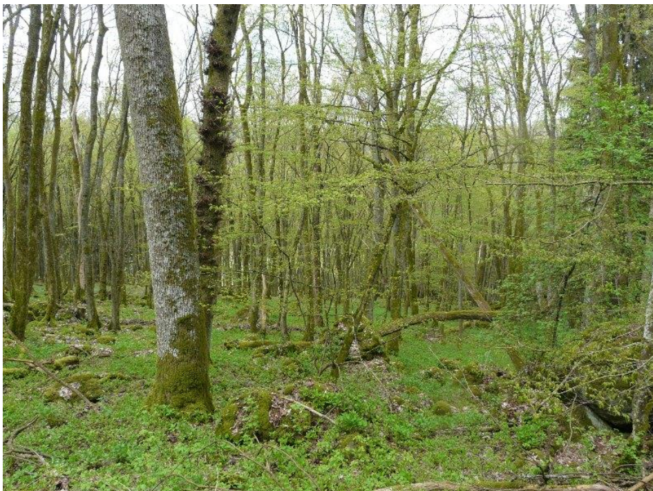
Abb. 2: Eschen-Ahorn- Schluchtwald unterhalb der Eishöhlen im Fischbachtal