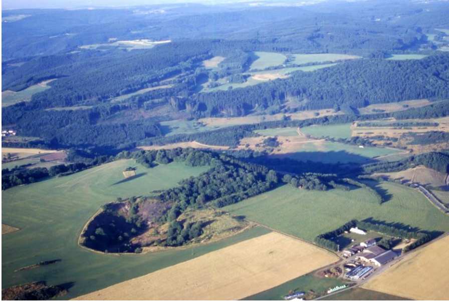
Abb. 7: Blick aus Nordosten auf den Vulkan Kalem mit ehemaliger Lavagrube