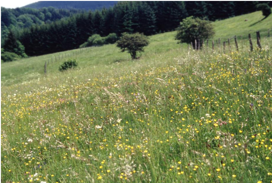
Abb. 6: Artenreicher Mähwiesenbereich im mittleren Fischbachtal