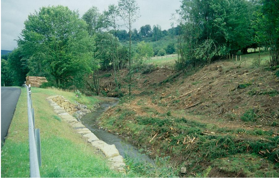
Abb. 5: Entfichteter Bachauenbereich des Fischbaches