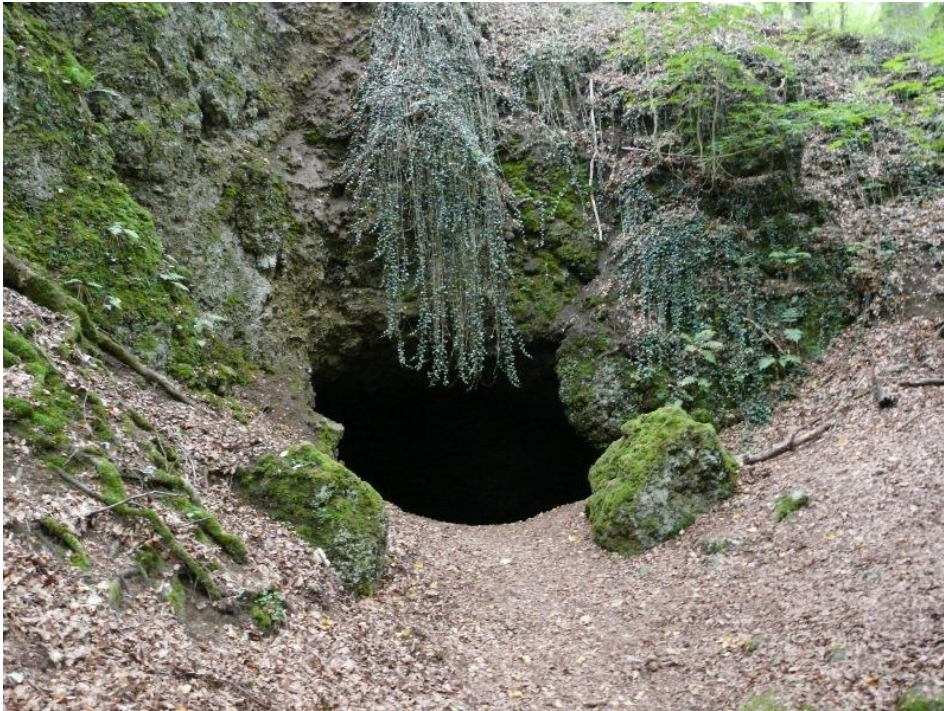
Abb. 3: Höhleneingang zur ehemaligen Mühlsteinhöhle – Eishöhle im Fischbachtal