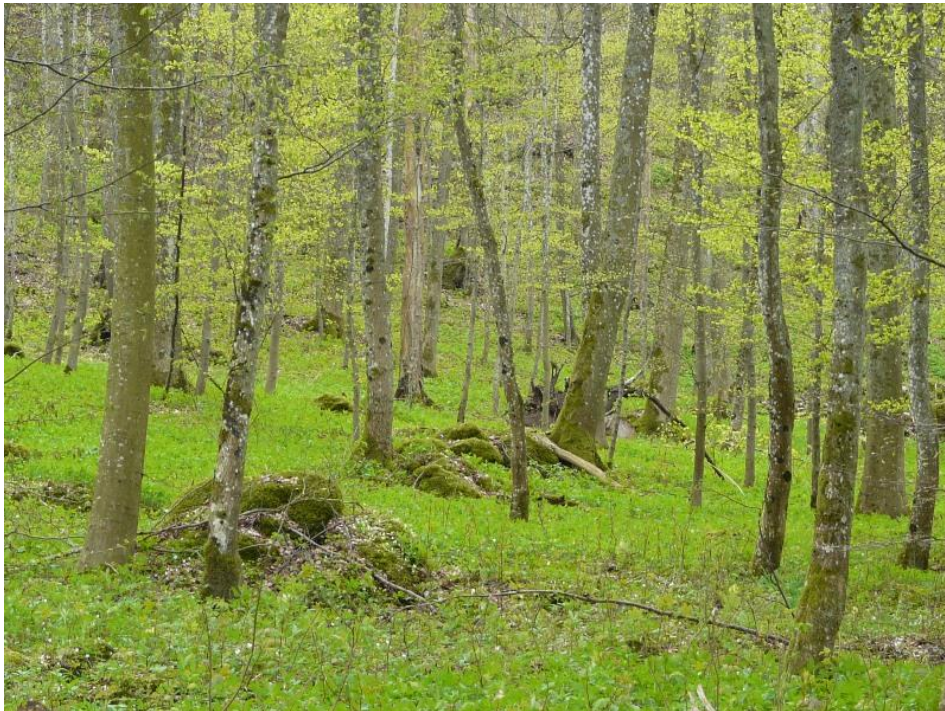
Abb. 1: Waldmeister- Buchenwald mit vereinzeltem Blockschutt – Fischbachtal.