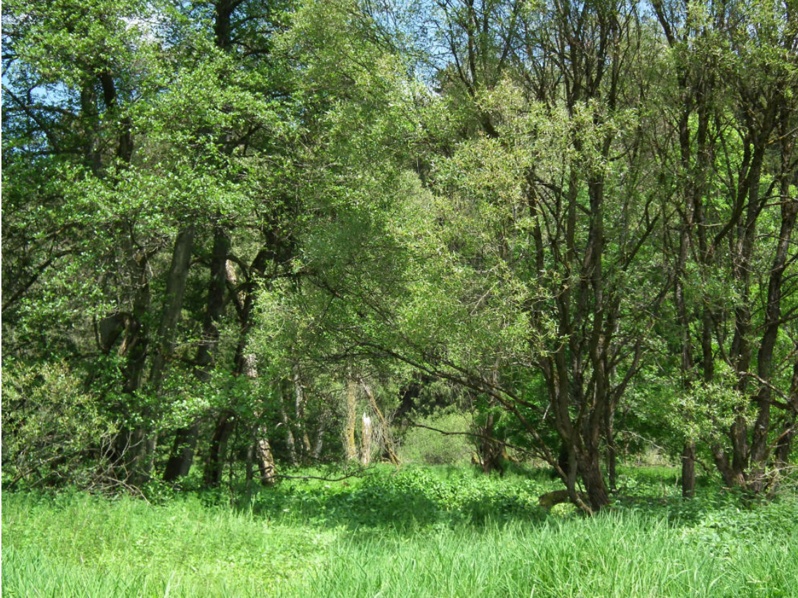
Abb. 3: Bachbegleitender Auwaldrest (FFH-LRT 91E0*) am Alfbach in Höhe des Brandscheiderhofes