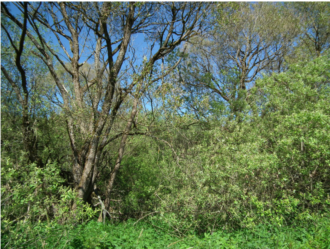
Abb. 8: Bachbegleitender Auwaldrest (FFH-LRT 91E0*) mit Bruchweide nördlich Hernack-Berg