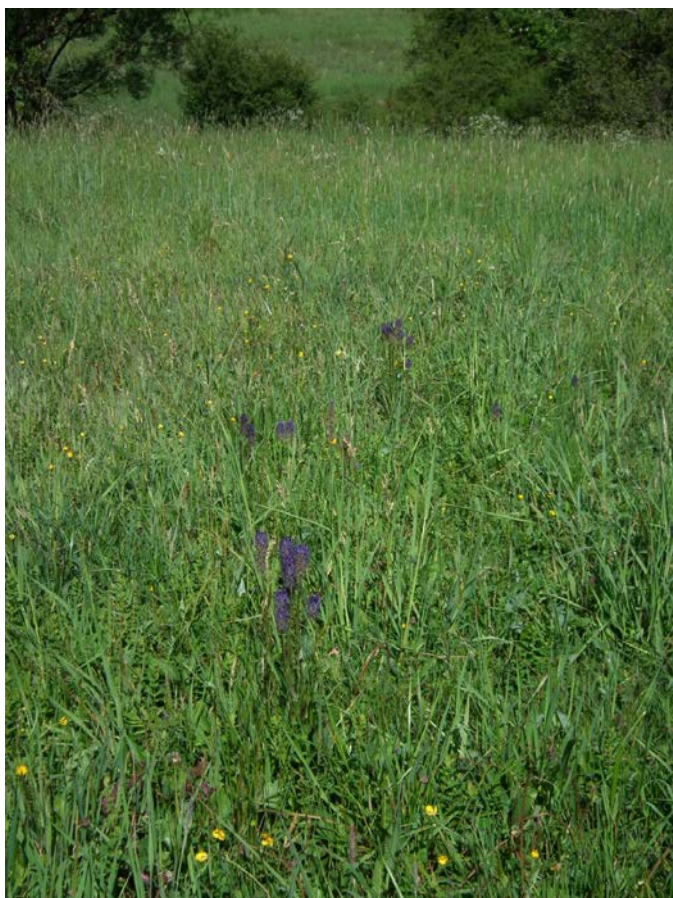
Abb. 16: Extensive Mähwiese (FFH-LRT 6510) nordwestlich Pronsfeld