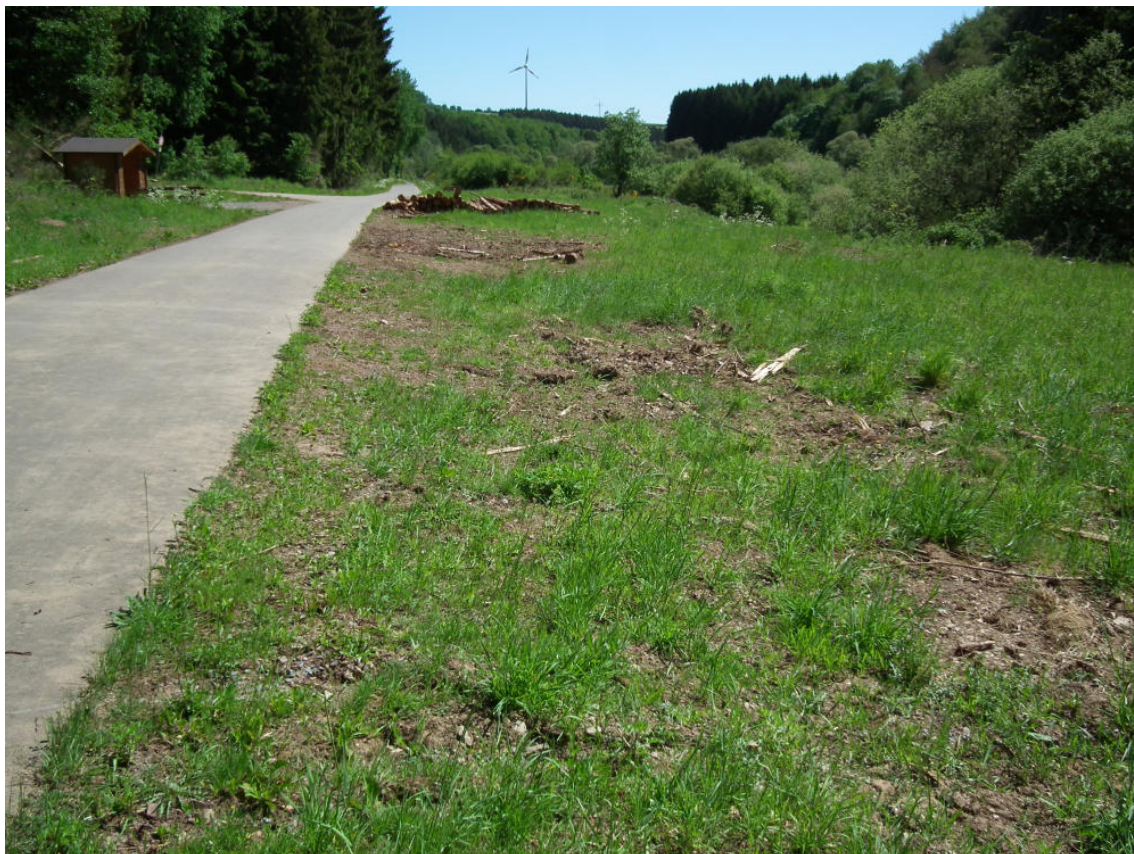
Abb. 13 Radweg im Alfbachtal östlich des Hernack-Berges