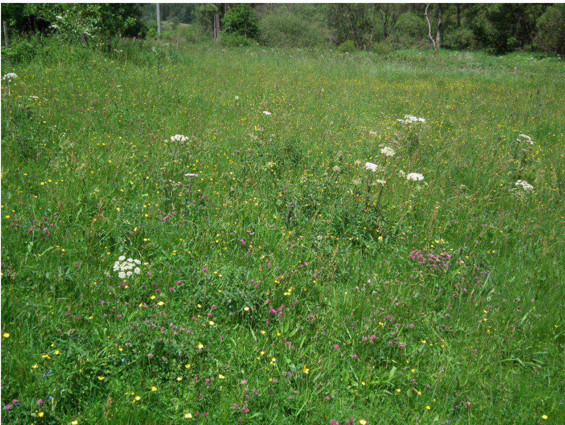
Abb. 4: Extensive Wiese (FFH-LRT 6510) im Alfbachtal beim Brandscheiderhof