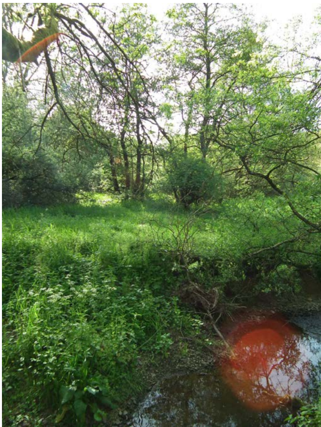
Abb. 19: Rest eines bachbegleitenden Erlenwaldes (FFH-LRT 91E0*) am Bierbach nördlich Rehbüsch