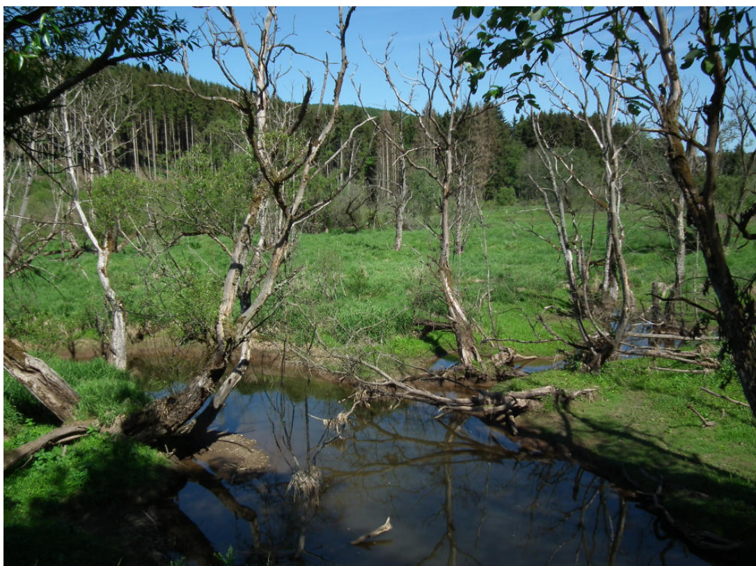
Abb. 10: Alfbach mit Gelände des ehemaligen Biberstaus östlich des Hernack-Berges