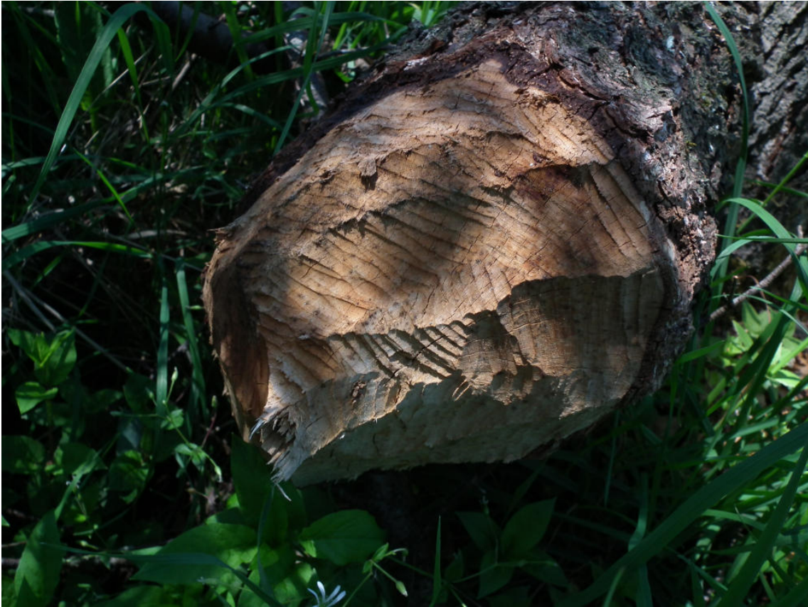
Abb. 11: Biberspuren an einem gefällten Baumstamm am Alfbach östlich des Hernack-Berges