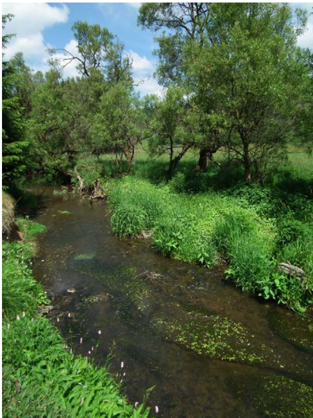
Abb. 2: Alfbach (FFH-LRT 3260) mit Schwimmbblattvegetation in Höhe des Brandscheiderhofes