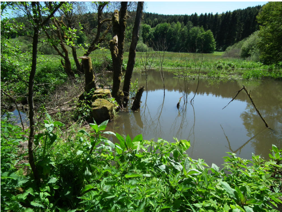
Abb. 12: Biberstau am Alfbach östlich des Hernack-Berges