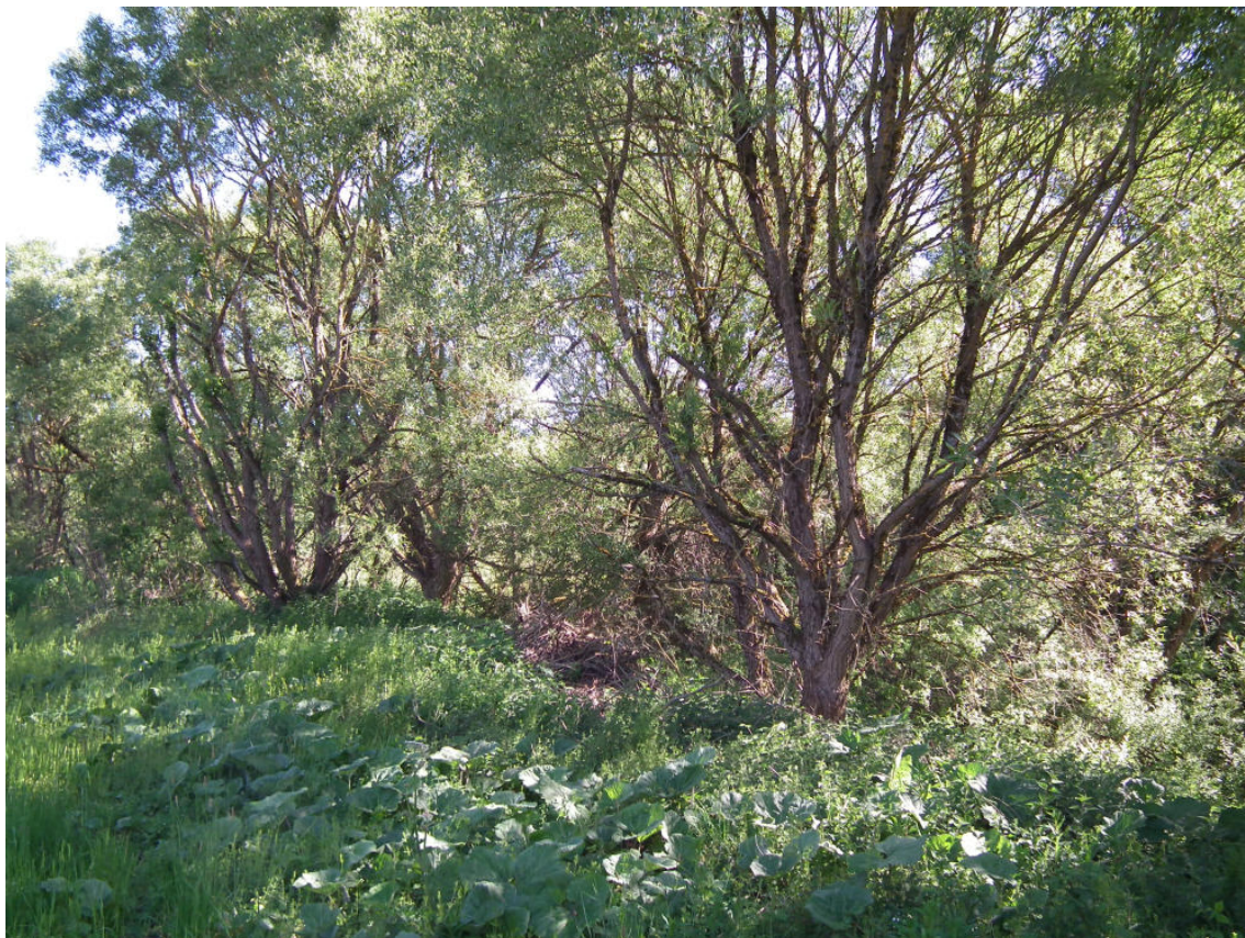
Abb. 15: Ufergehölz des Alfbachs mit Pestwurzflur nordwestlich Pronsfeld