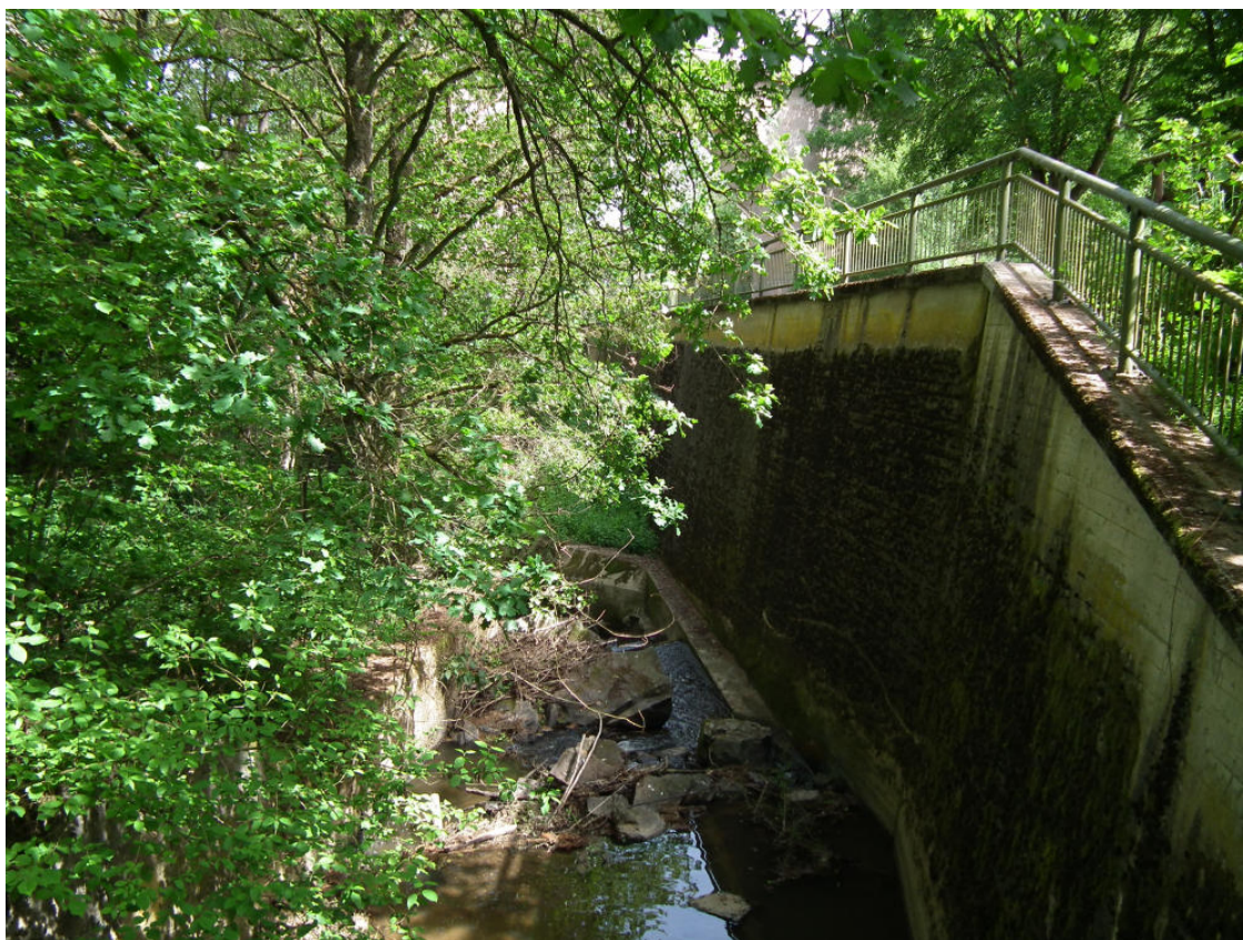
Abb. 22: Bierbach mit Stützmauer der Kreisstraße östlich des Eifel-Zoos