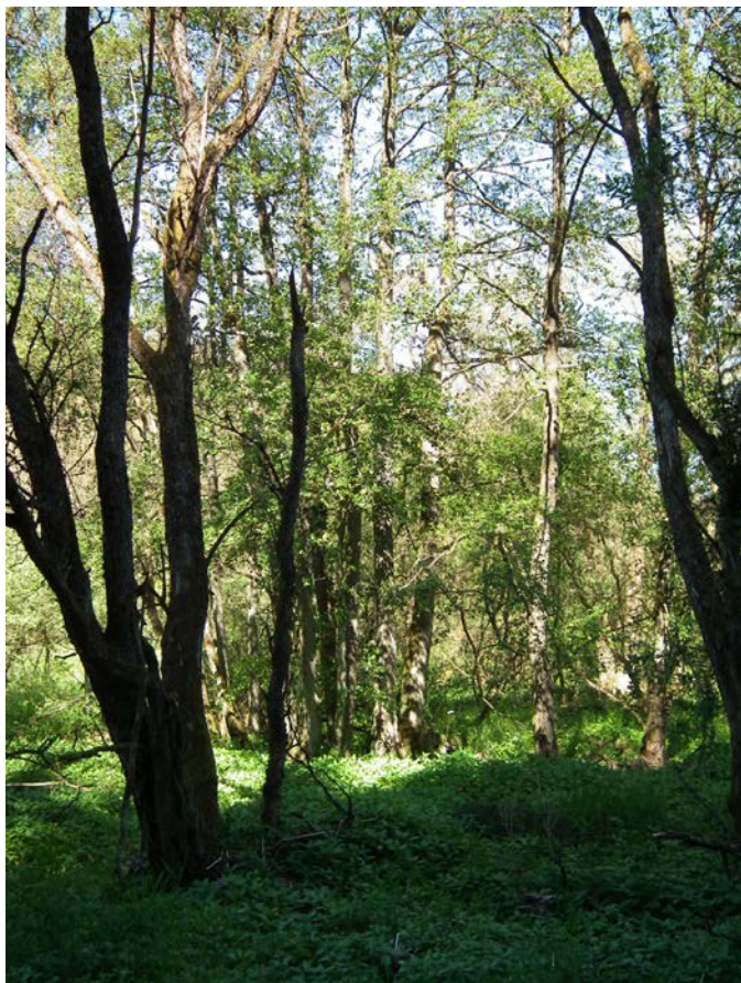
Abb. 9: Bachbegleitender Auwald (FFH-LRT 91E0*) nördlich Hernack-Berg