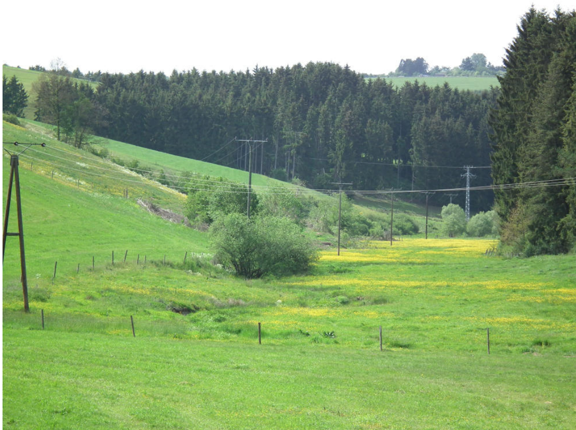
Abb. 21: Bierbachtal östlich Masthorn