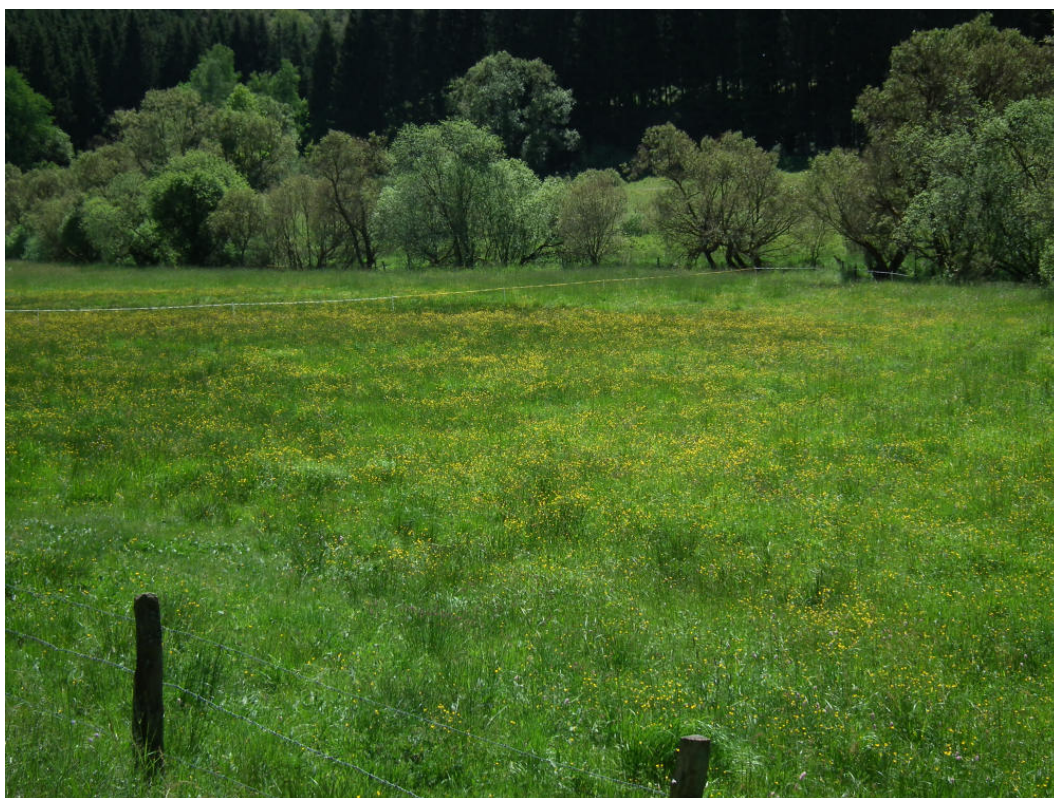
Abb. 6: Feuchtweide am Alfbach südlich Habscheider Mühle