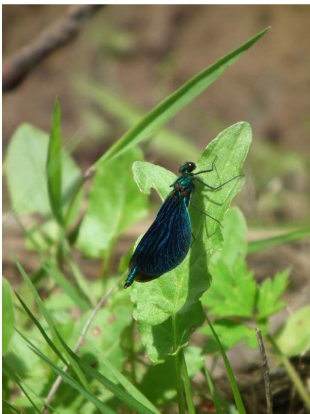
Abb. 20: Blauflügelige Prachtlibelle ( Calopteryx virgo ) am Bierbach