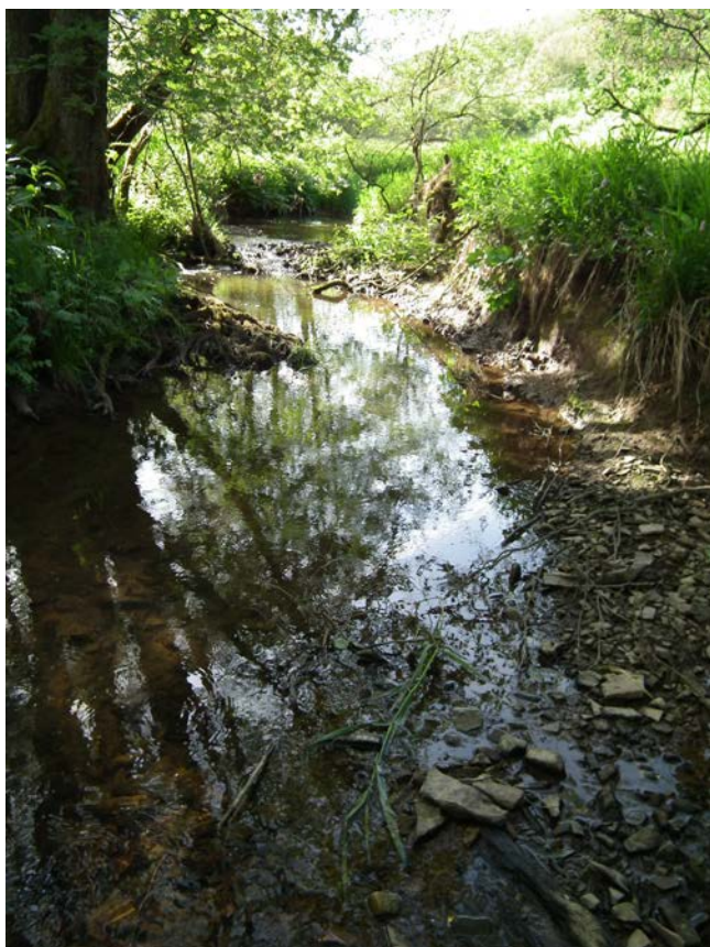
Abb. 18: Bierbach nördlich Rehbüsch