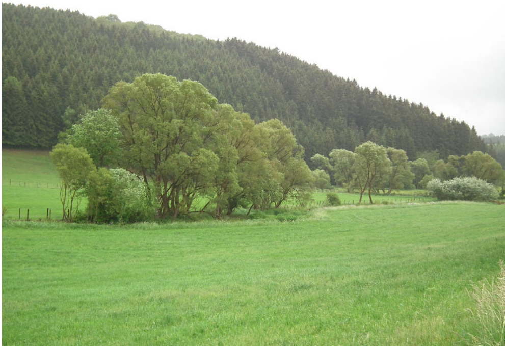
Abb. 1: Alfbachtal zwischen Bleialf und Großlangenfeld