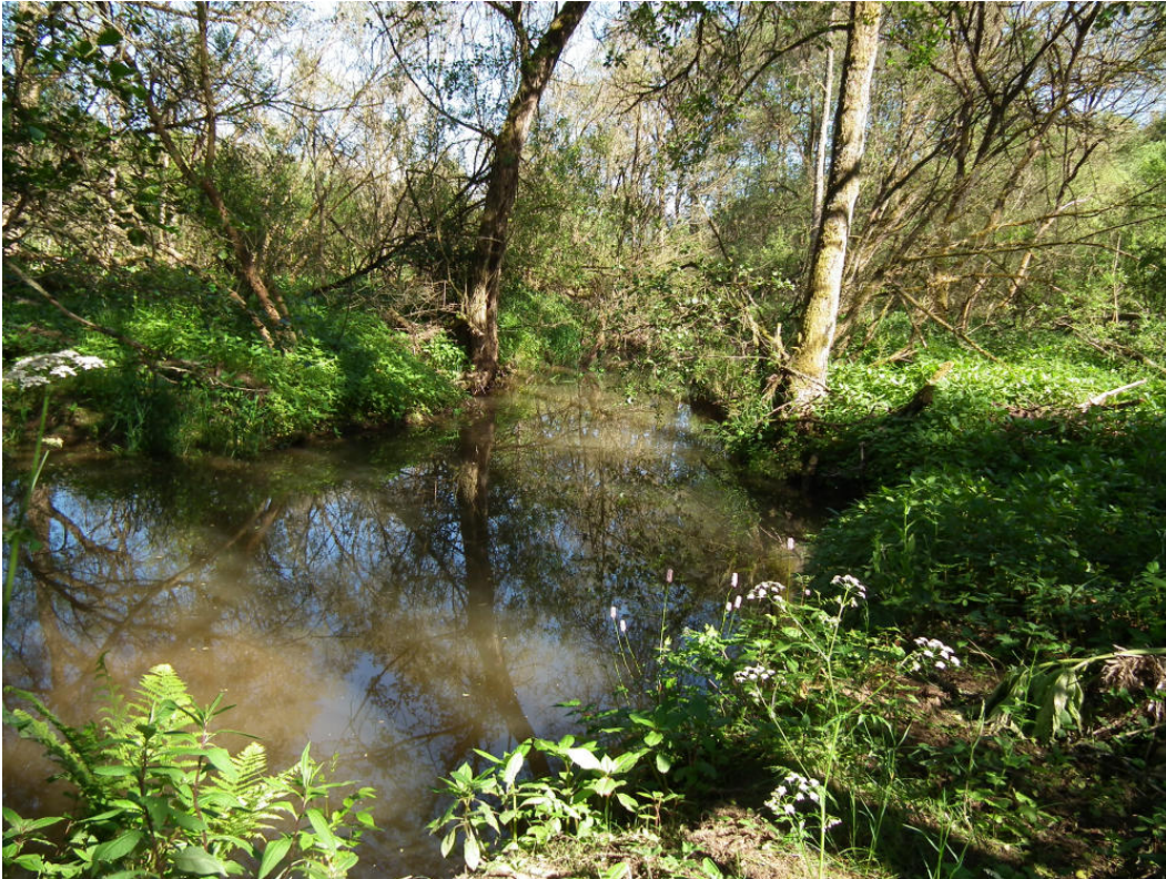
Abb. 7: Alfbach (FFH-LRT 3260) nördlich Hernack-Berg