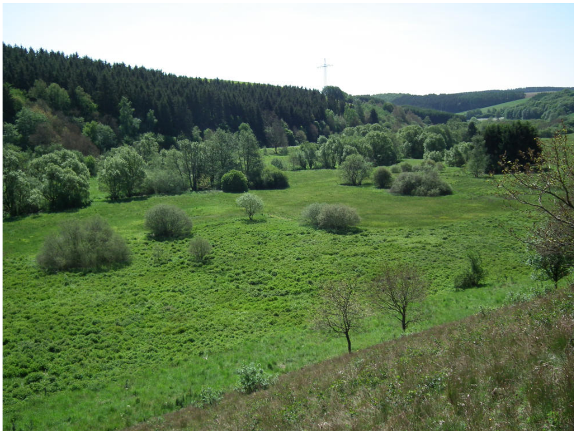
Abb. 17: Alfbachtal westlich Pronsfeld