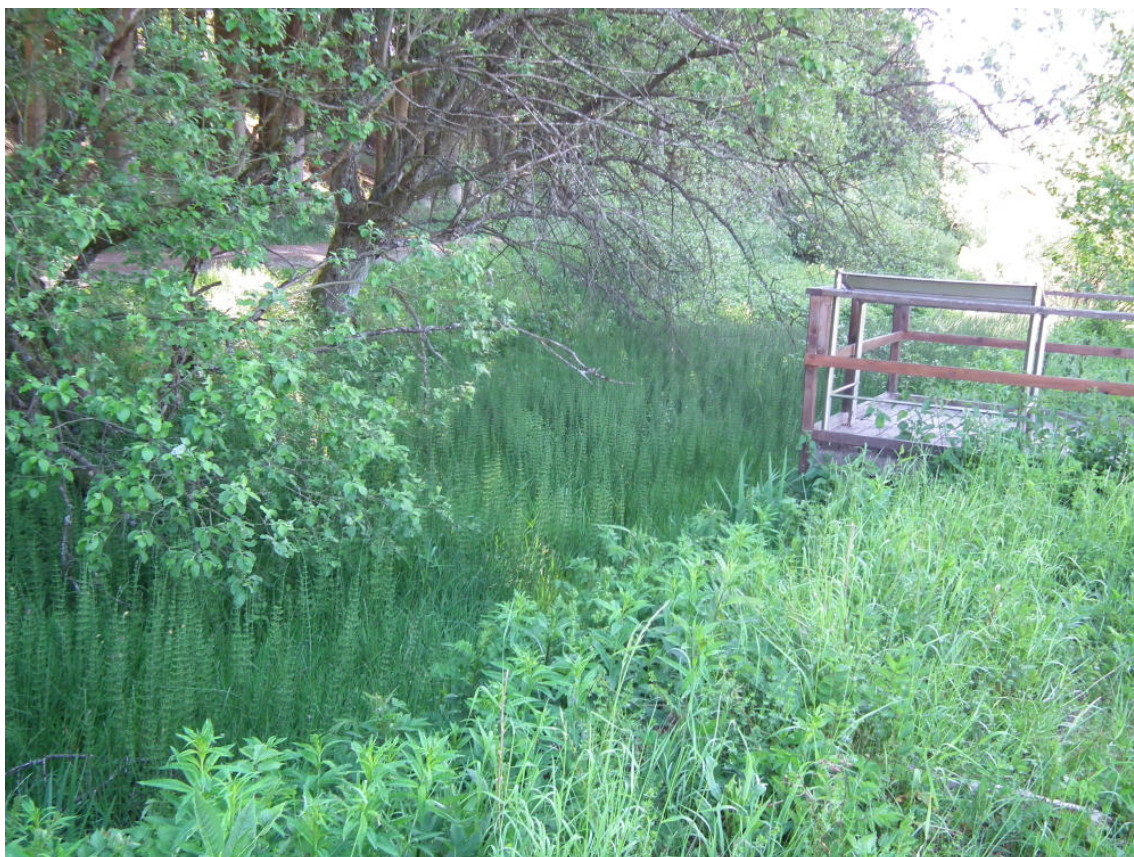
Abb. 14: Verlandeter Teich am Radweg östlich des Hernack-Berges