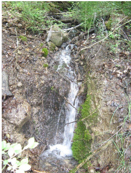
Abb. 11: Versinterter Quellbach im Wald östlich der Prümzurlayer Wasserfälle (LRT 7220). Koordinaten: 316547, 5525773/ Aufnahmedatum: 15.05.2011