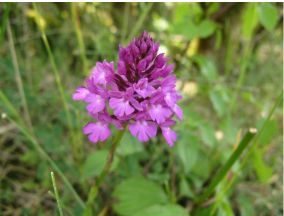
Abb. 23: Pyramiden-Spitzorchis ( Anacamptis pyramidalis) in den Scharren am Hartberg nordöstlich Schankweiler. Aufnahmedatum: 24.05.2011