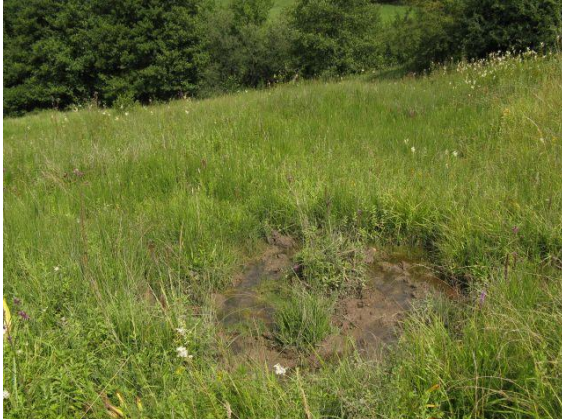
Abb. 10: Kalksumpf östlich Holsthum (LRT 7230). Koordinaten: 315272, 5529630/ Aufnahmedatum: 17.05.2011