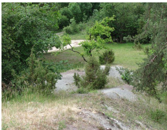
Abb. 6: Wachholderheide im NSG "Scharren bei Dockendorf" (LRT 5130). Koordinaten: 317436, 5532856/ Aufnahmedatum: 26.05.2011