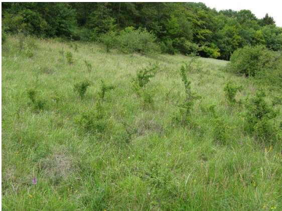
Abb. 3: Magerrasen bei den Scharren westlich Birtlingen (LRT 6210), verbuschend. Koordinaten: 318072, 5536860/ Aufnahmedatum: 08.07.2011