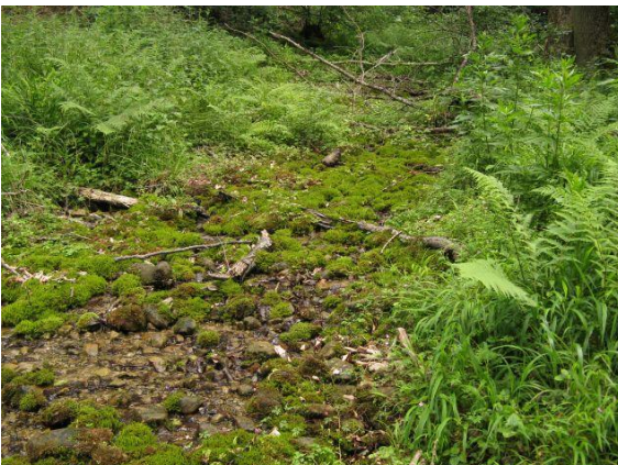
Abb. 12: Sinterquelle im Dahlembach-Quellgebiet (LRT 7220). Koordinaten: 316145, 5529519/ Aufnahmedatum: 15.06.2011