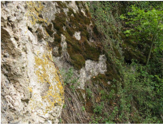
Abb. 19: Kalkfelsen an der "Huwelslay" (LRT 8210). Koordinaten: 314344, 5530708/ Aufnahmedatum: 15.07.2011