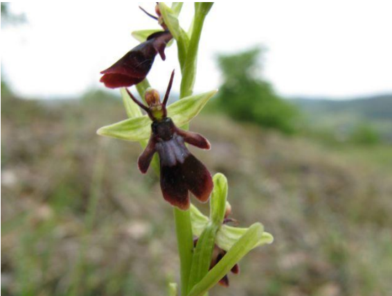
Abb. 22: Fliegenragwurz ( Ophrys insectifera) im NSG "Im Bühnchen östlich Peffingen".