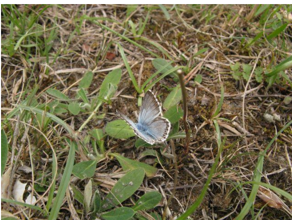
Abb. 26: Silberblauer Bläuling ( Lysandra coridon) im NSG "Scharren bei Dockendorf".