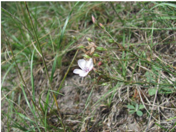
Abb. 20: Zarter Lein ( Linum tenuifolium) im Naturschutzgebiet "Scharren bei Dockendorf".