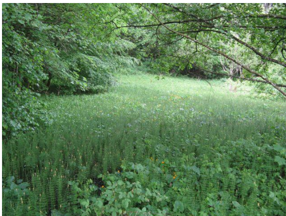
Abb.17: Nasswiese mit Riesenschachtelhalm ( Equisetum telmateia) im Wald südlich Holsthum (yEC1). Koordinaten: 314551, 5528721/ Aufnahmedatum: 15.05.2011