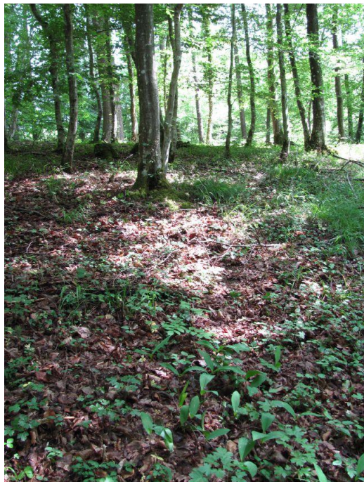
Abb. 13: Eichen-Hainbuchenwald im Bedhard zwischen Wolfsgraben und ehem. Militärgelände (LRT 9170), im Vordergrund Blätter des Maiglöckchens. Koordinaten: 318716, 5538103/ Aufnahmedatum: 06.06.2011