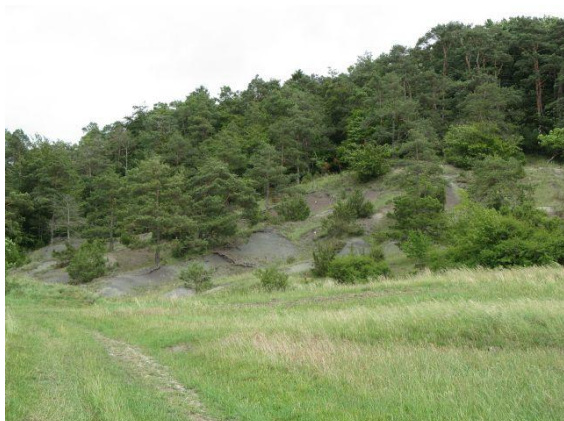
Abb. 7: Scharren am Sudigskopf östlich Wettlingen (LRT 5310). Koordinaten: 315272, 5534198/ Aufnahmedatum: 19.06.2011