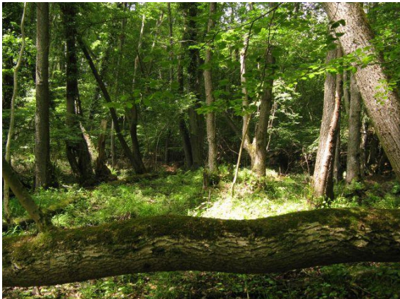
Abb. 15: Bachbegleitender Eschenwald zwischen Schankweiler und Peffingen (LRT 91E0). Koordinaten: 312962, 5531234/ Aufnahmedatum: 24.05.2011