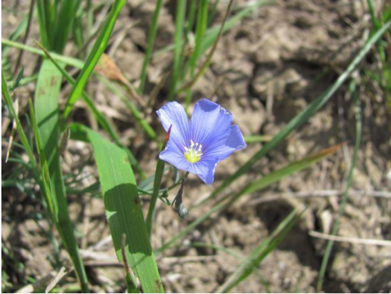
Abb. 21: Lothringener Lein ( Linum leonii) im Naturschutzgebiet "Scharren bei Dockendorf" Aufnahmedatum: 08.07.2011