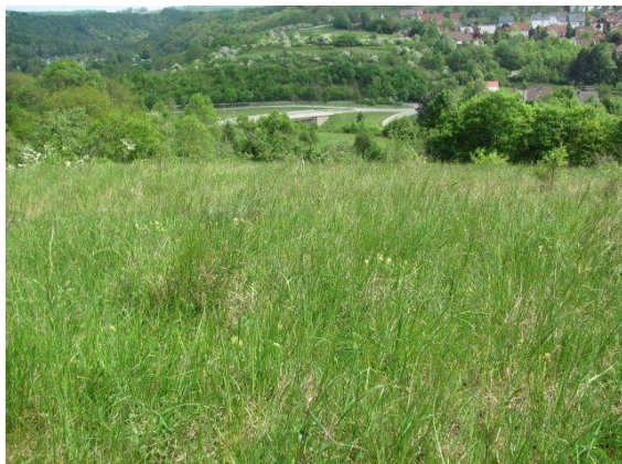
Abb. 8: Magerwiese nordwestlich des Irreler Friedhofs (LRT 6510). Koordinaten: 317033, 5525270/ Aufnahmedatum: 01.05.2011