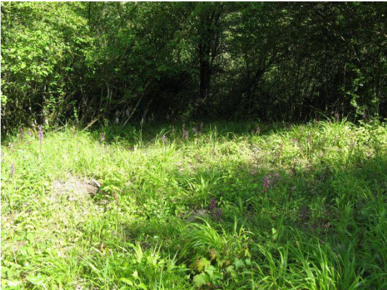
Abb.2 : Kalkmagerrasen südöstlich Holsthum (LRT 6210) mit Stattlichem Knabenkraut ( Orchis mascula); Blick in den verbuschten Randbereich mit Purpur-Knabenkraut ( Orchis purpurea). Koordinaten: 315338, 5529004/ Aufnahmedatum: 13.05.2011