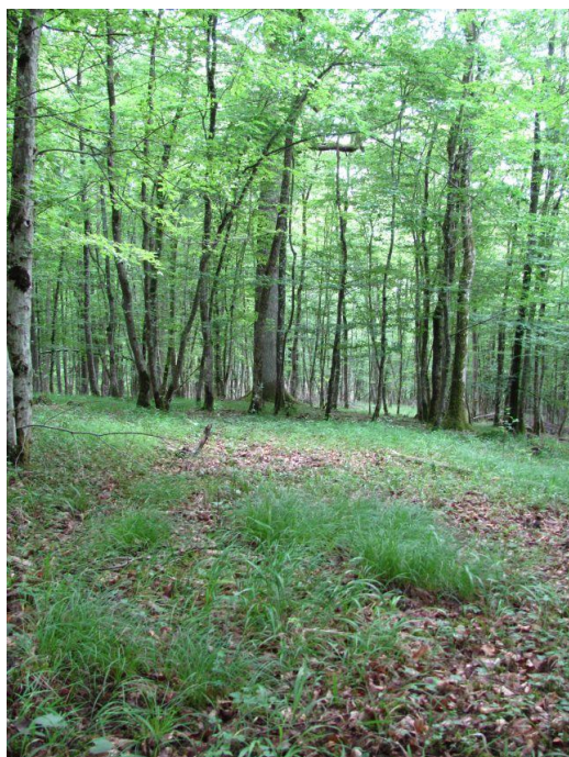
Abb. 14: Eichen-Hainbuchenwald im Bedhard zwischen Wolfsgraben und ehem. Militärgelände (LRT 9170), im Mittelgrund Horste der Berg-Segge. Koordinaten: 318767, 5538030/ Aufnahmedatum: 06.06.2011