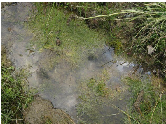
Abb. 25: Armleuchteralgen ( Chara spec.) im Kalksumpf östlich Holsthum.