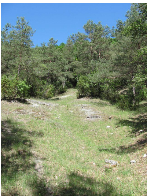
Abb. 5: Kleiner Keuperscharren nordwestlich Peffingen (LRT 5130). Koordinaten: 313044, 5532286/ Aufnahmedatum: 25.05.2011