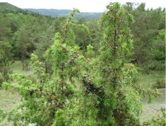
Abb. 24: Wacholder ( Juniperus communis) in den Scharren am Sudigskopf östlich Wettlingen. Aufnahmedatum: 19.06.2011