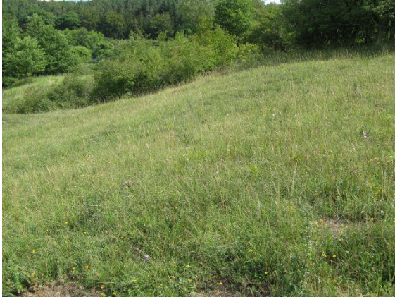
Abb. 1: Scharren am Dedigerberg östlich Holsthum (LRT 6210). Koordinaten: 315252, 5529583/ Aufnahmedatum: 15.07.2011