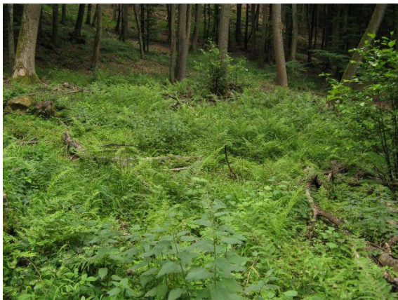
Abb. 16: Feuchtwald im Quellbereich des Dahlembaches (LRT 91E0). Koordinaten: 316109, 5529485/ Aufnahmedatum: 15.06.2011