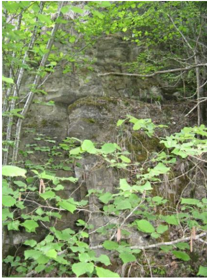
Abb. 18: Felsgebüsch (yBB7) und Sandsteinfelsen oberhalb der alten Bahnlinie östlich Irrel. Koordinaten: 317664, 5525626/ Aufnahmedatum: 12.05.2011