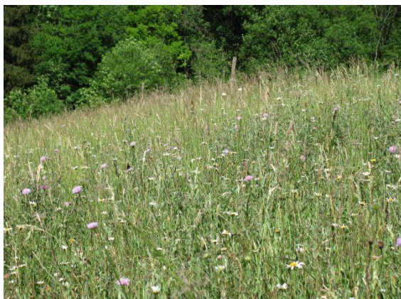
Abb. 9: Magere, blütenreiche Streuobstweide südwestlich von Hosthum (LRT 6510). Koordinaten: 312748, 5529534/ Aufnahmedatum: 25.05.2011