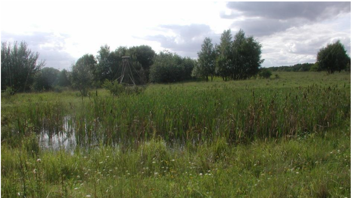
Halboffene Weidelandschaft Schmidtenhöhe bei Koblenz, Amphibiengewässer