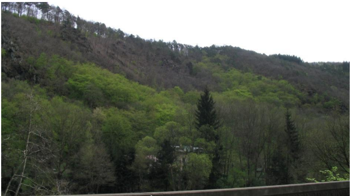
Waldaspekt des Lahnhangs in der Nähe von Gutenacker