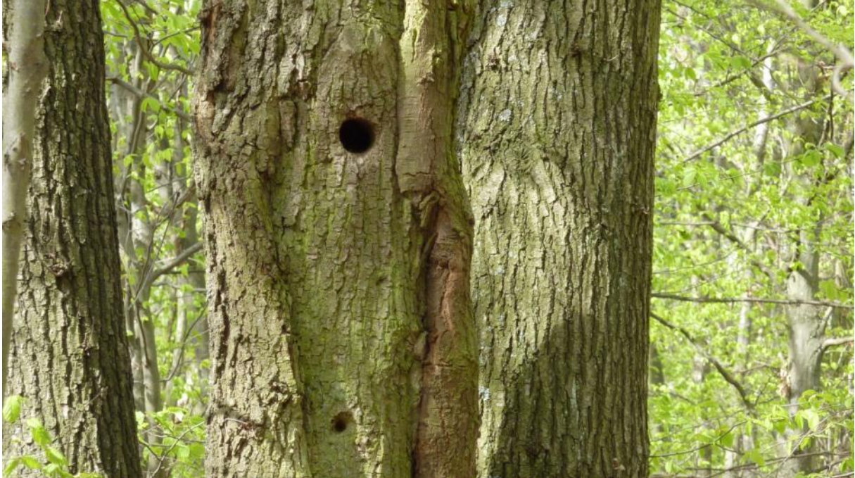
Spechthöhle im Wald nördlich Fachingen