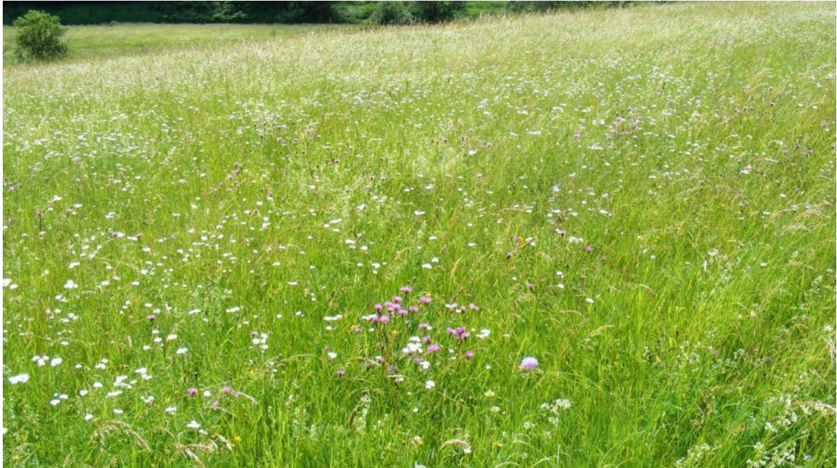
Sommeraspekt einer artenreichen Wiese