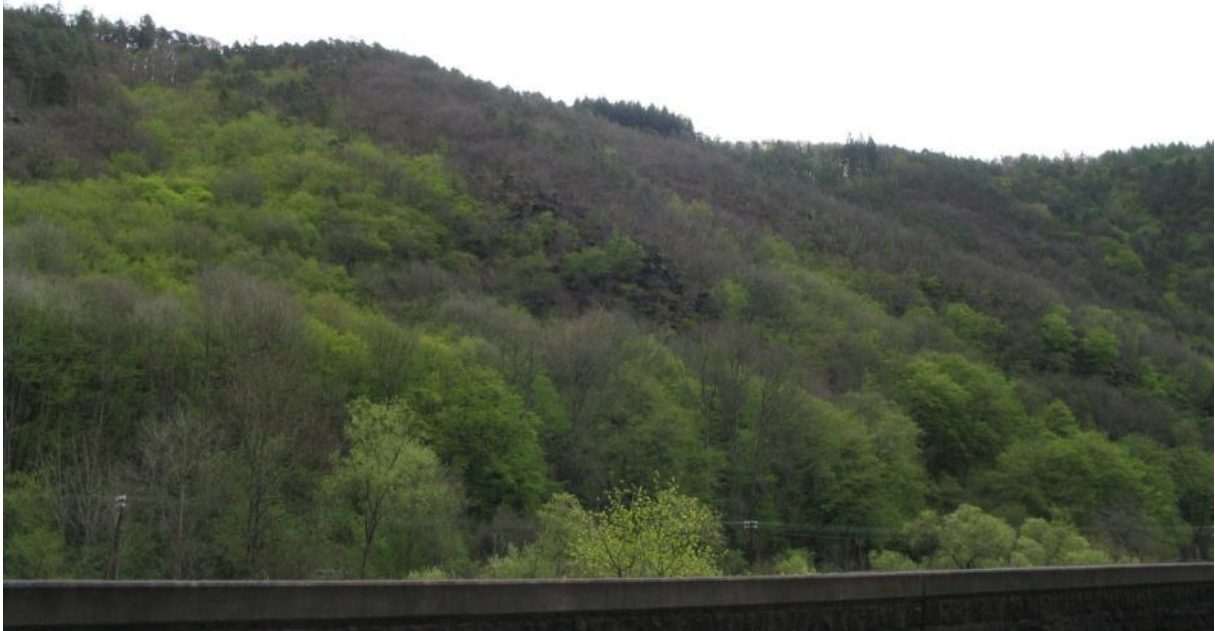
Fledermausbiotope westlich Gutenacker