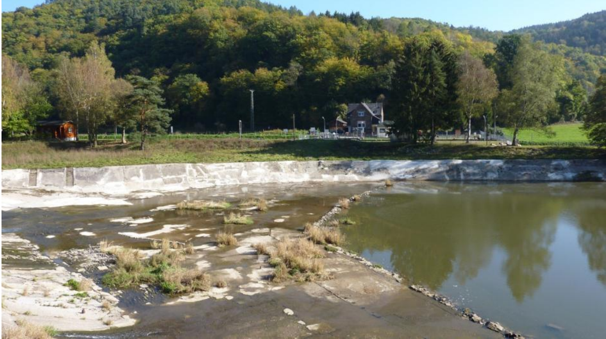
Flachwasserbereiche an der Schleuse Hollerich, Lebensraum der Würfelnatter