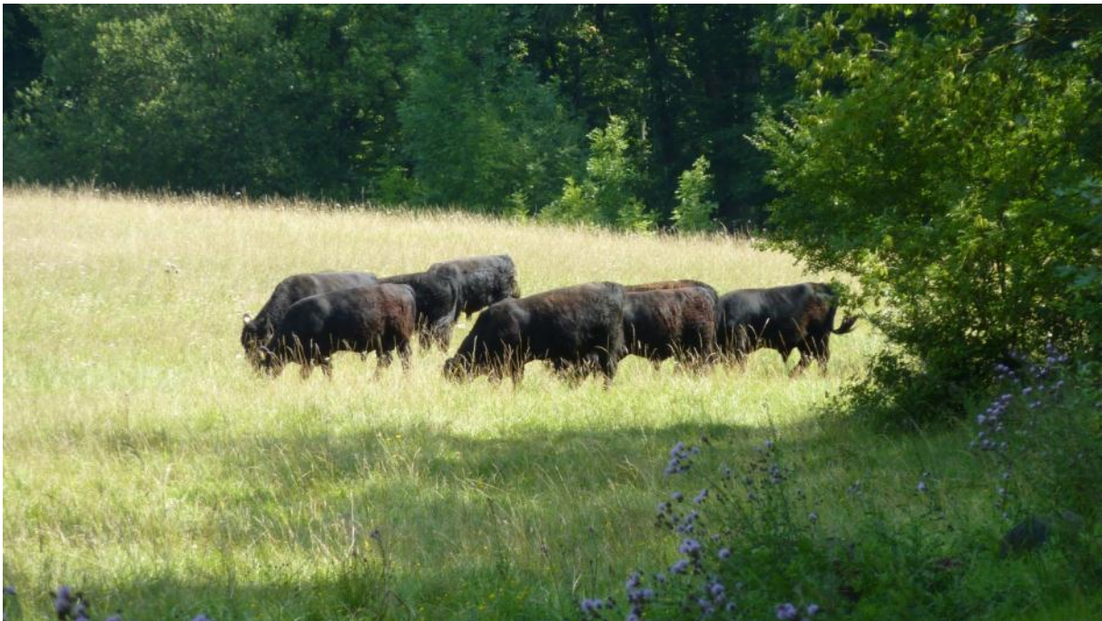
Halboffene Weidelandschaft Schmidtenhöhe, Beweidung mit Taurusrindern