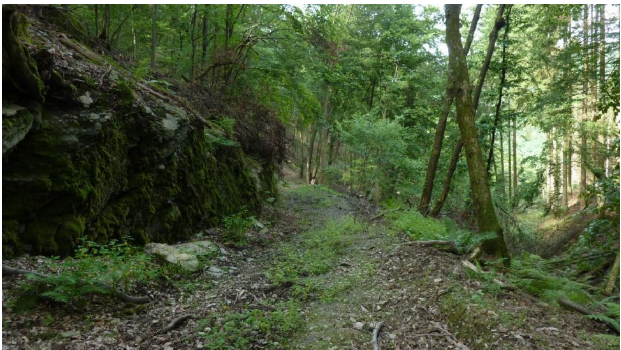
Dörsbachtal unterhalb des Beilsteins südöstlich Attenhausen