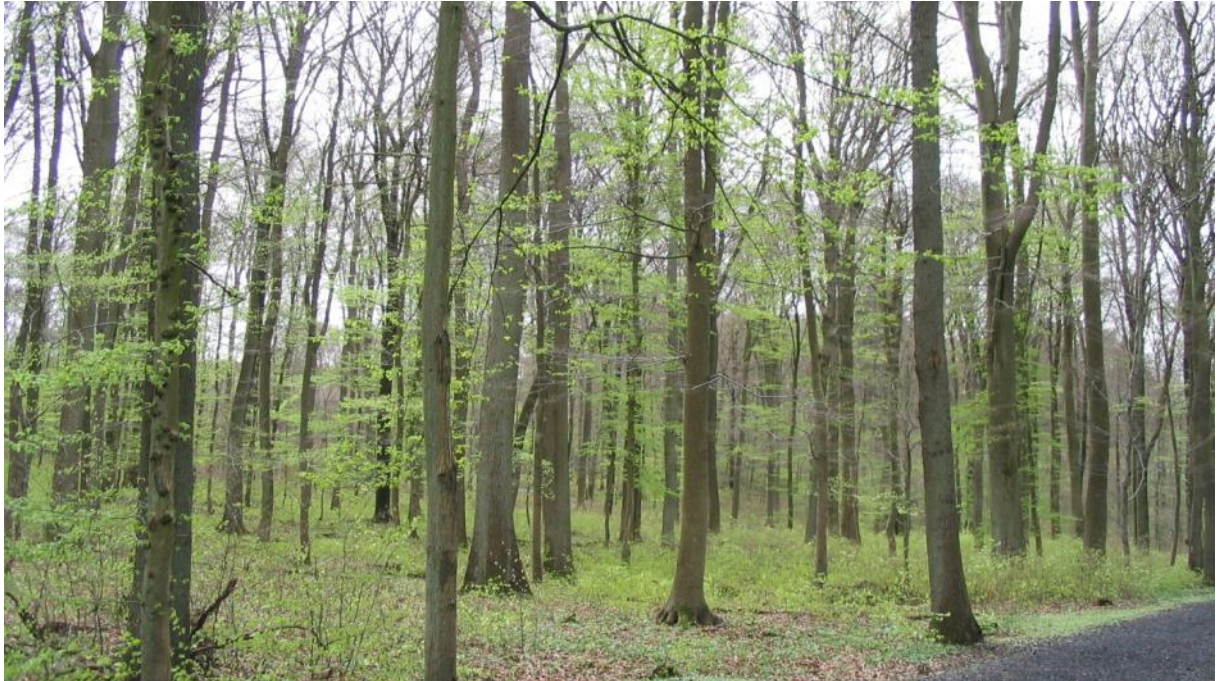
Aspekt des Horchheimer Waldes