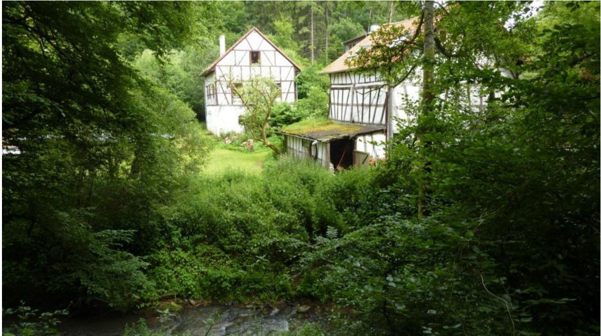
Mühle am Hasenbach