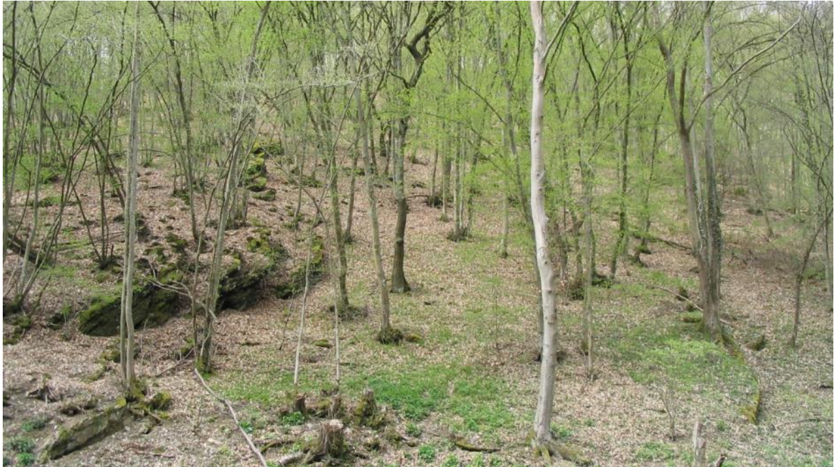
Waldaspekt südöstlich von Steinsberg