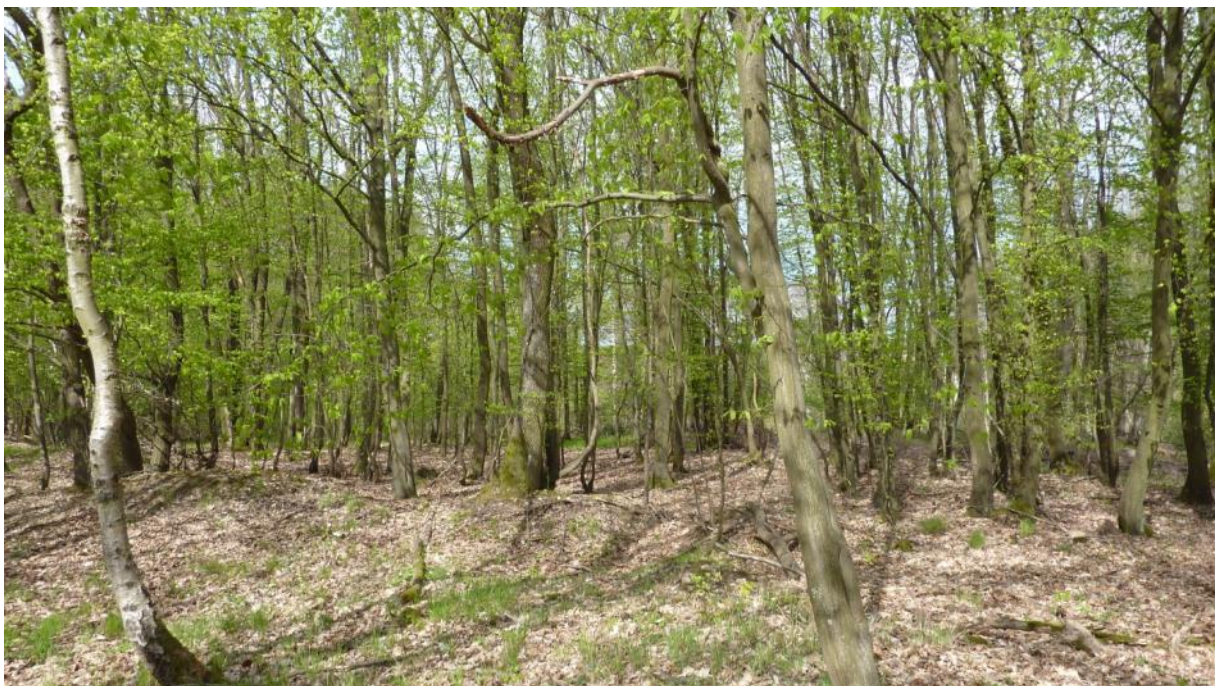
Am Geisberg nördlich Fachingen