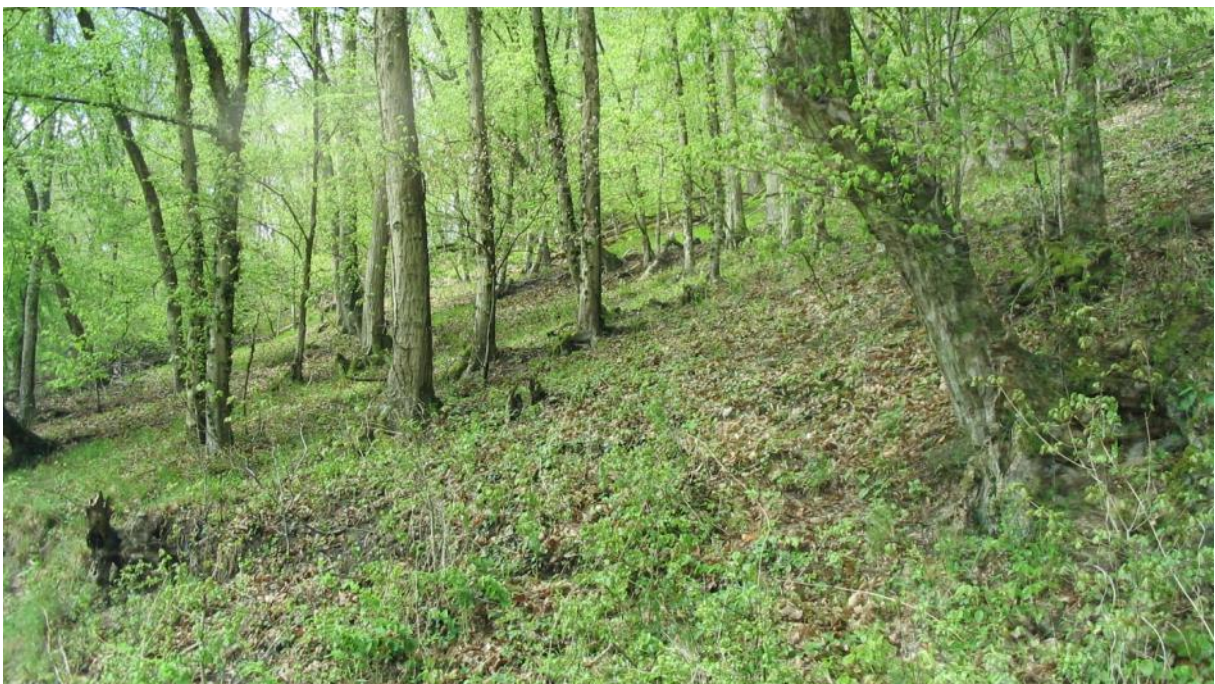
Lebensraum der Bechsteinfledermaus nordwestlich Bremberg