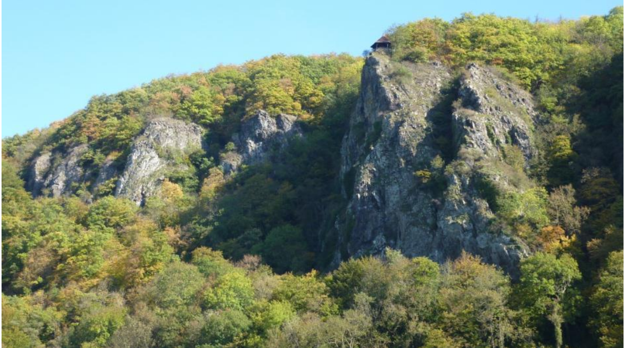
Waldhänge rund um den Gabelstein