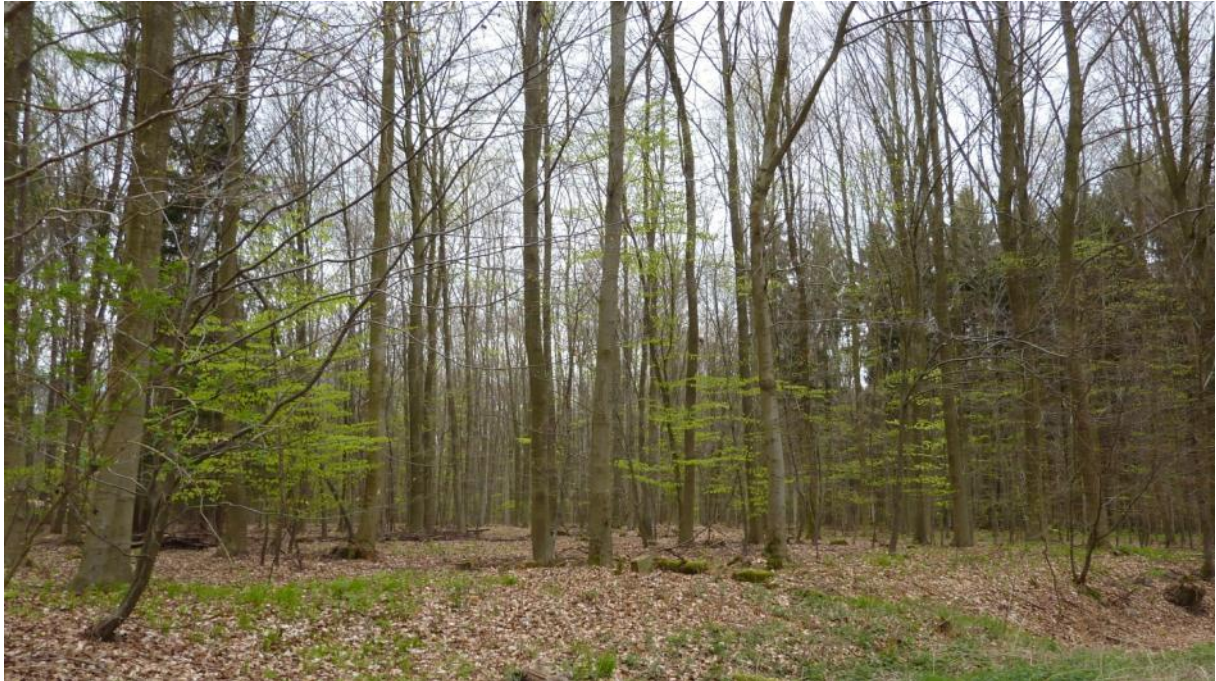
Waldaspekt Schollenberg nordwestlich Heistenbach