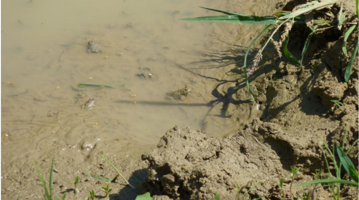
Schmidtenhöhe bei Koblenz, Pfütze mit Gelbbauchunken