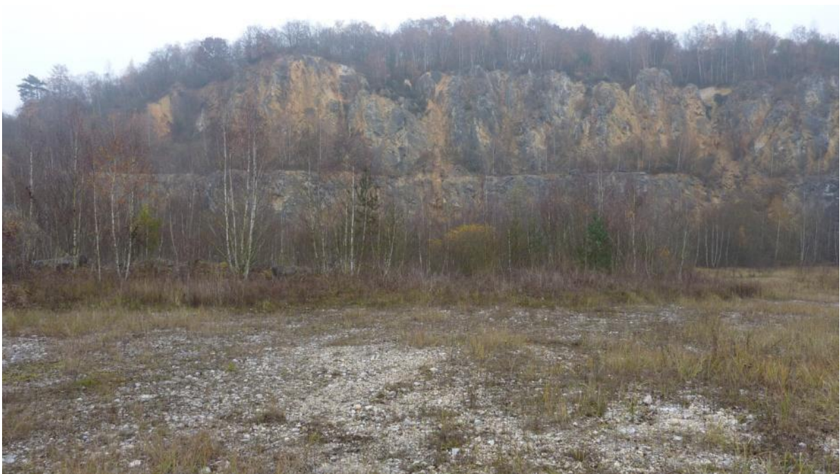
Spätherbst im Steinbruch Fachingen