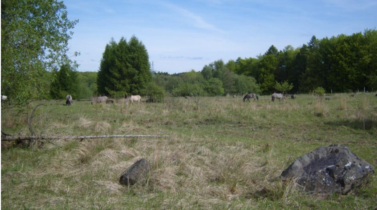
Halboffene Weidelandschaft Schmidtenhöhe bei Koblenz, Beweidung mit Koniks