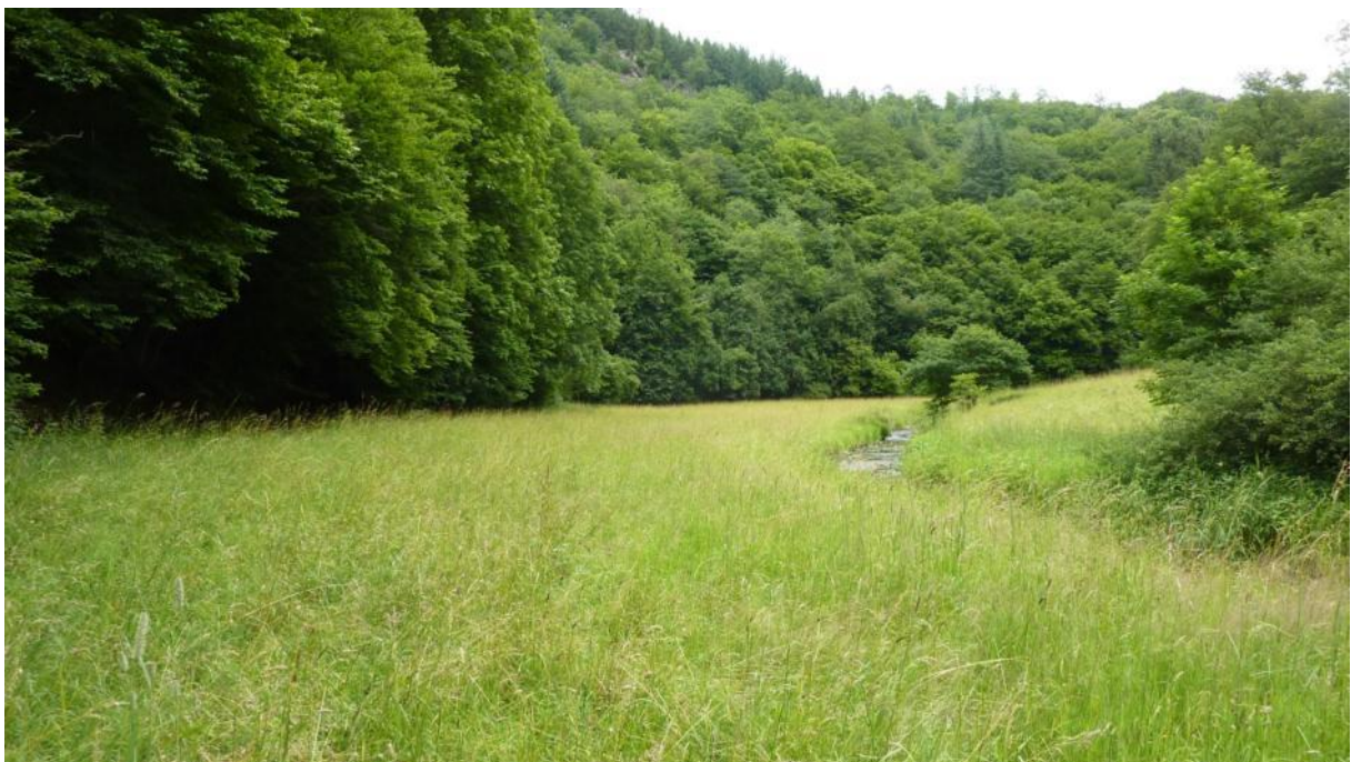
Wiesen im Dörsbachtal an der Neubäckersmühle nordöstlich Singhofen