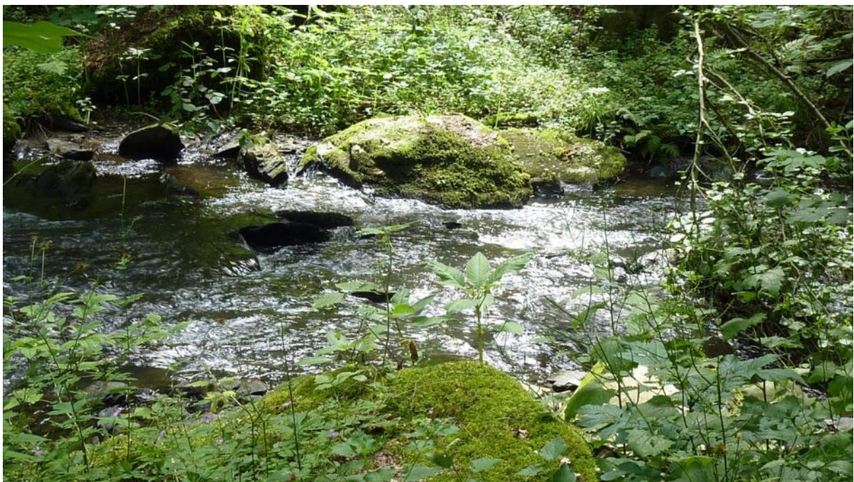
Aspekt des Dörsbachs im Jammertal westlich Kördorf