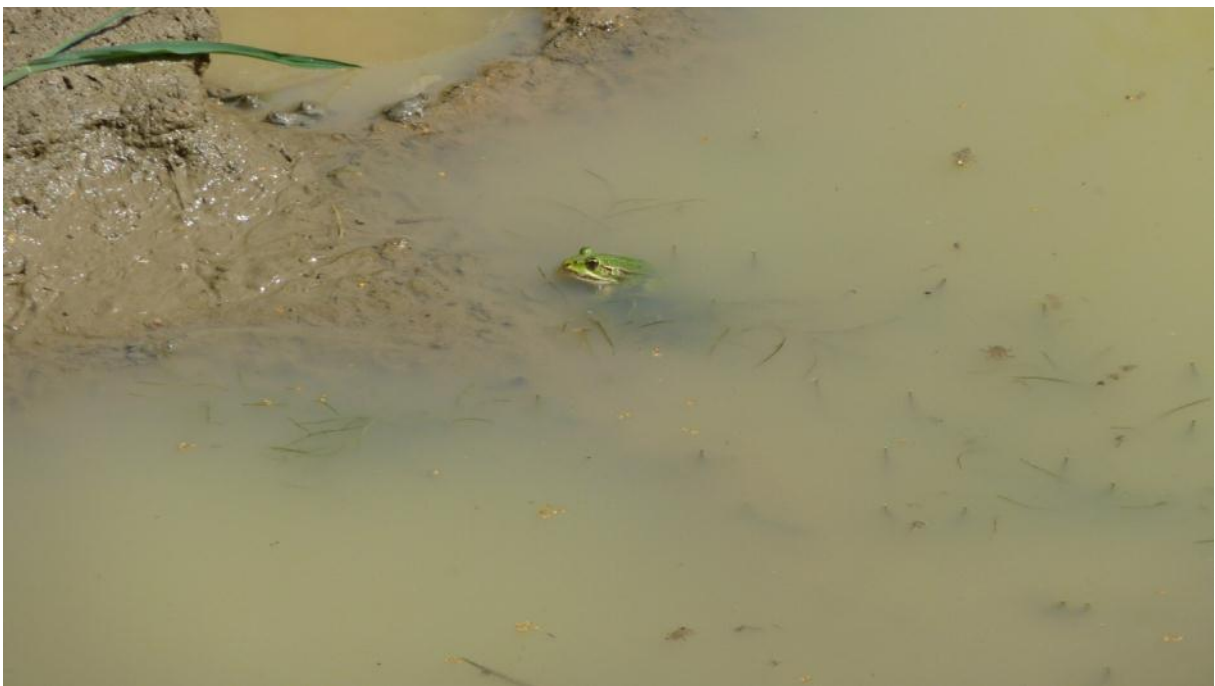
Schmidtenhöhe bei Koblenz, Tümpel mit Grünfrosch