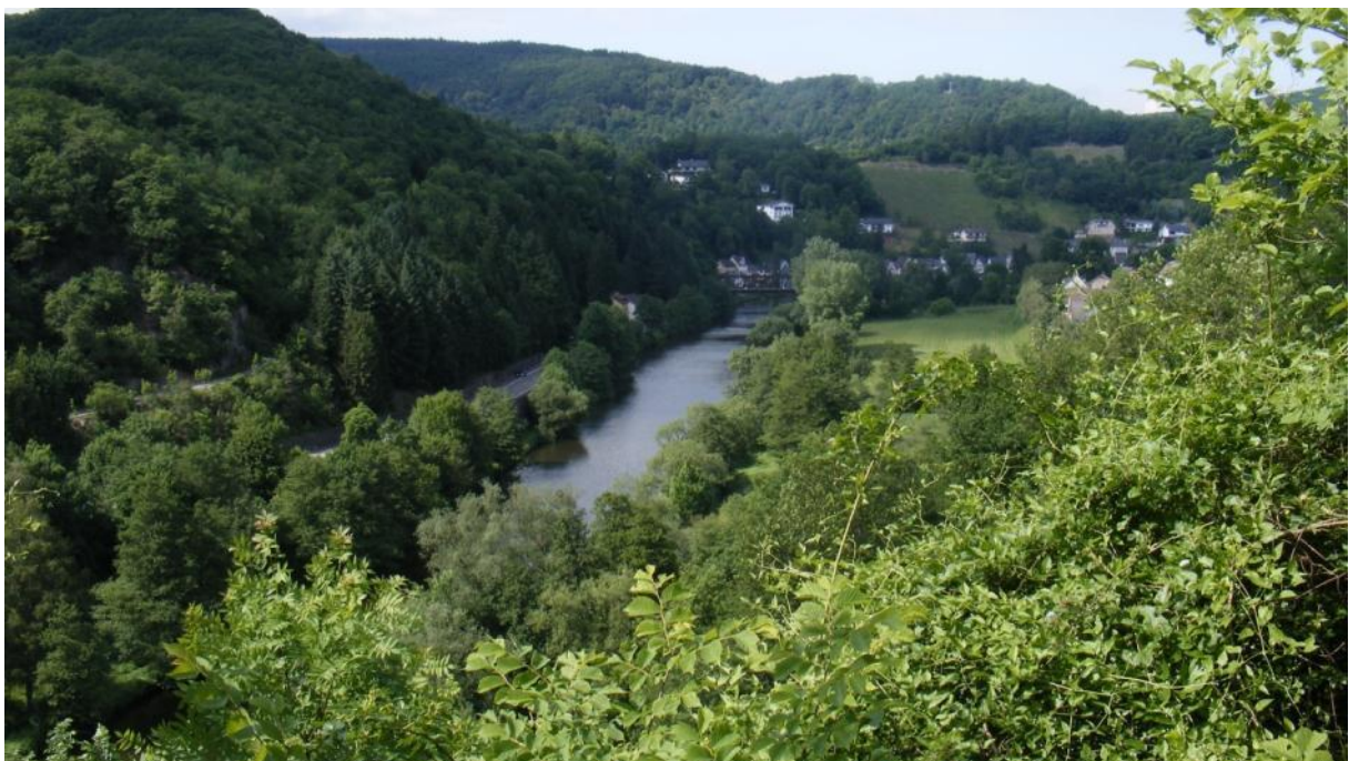
Blick in das Lahntal und auf die bewaldeten Hänge