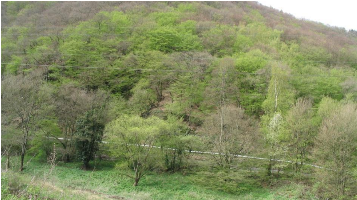
Lebensraum der Bechsteinfledermaus bei der Schleuse Kalkofen