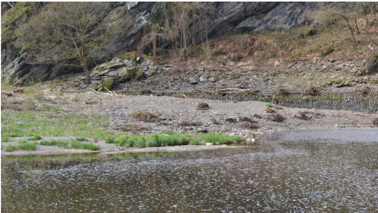
Kies- und Felsufer im NSG Schleuse Hollerich