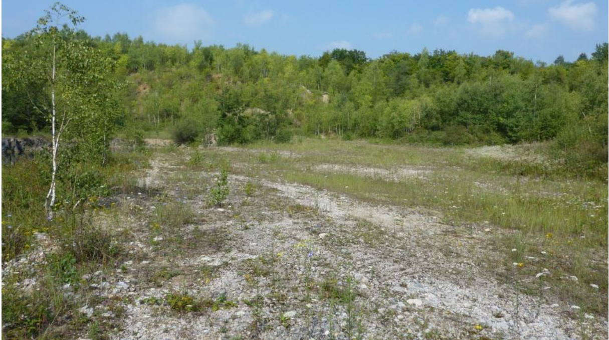
Rohböden im Steinbruch Fachingen