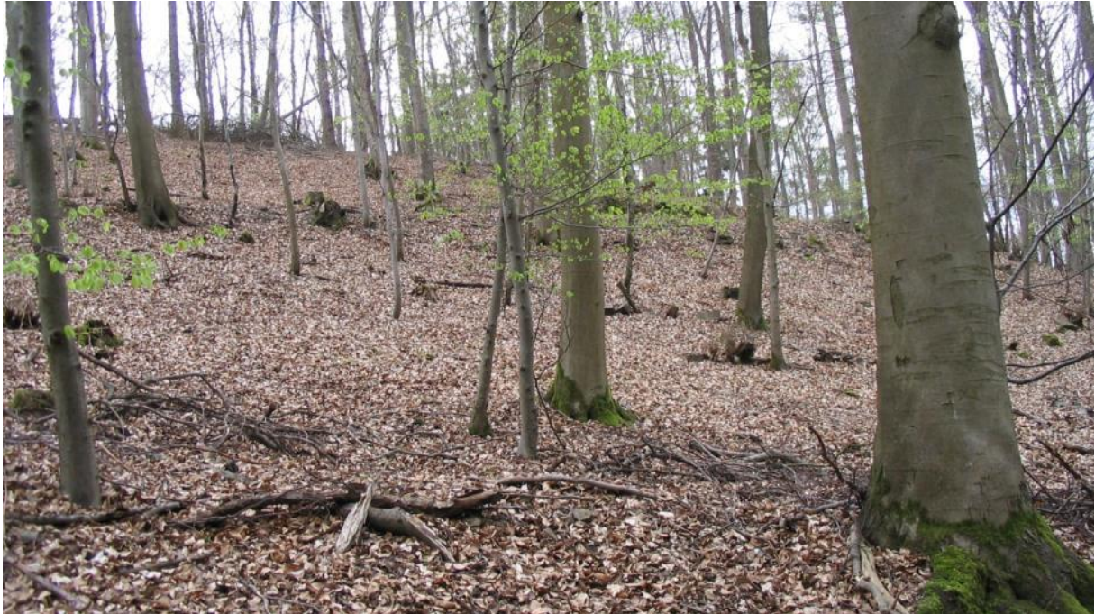
Lebensraum des Großen Mausohrs bei Roth