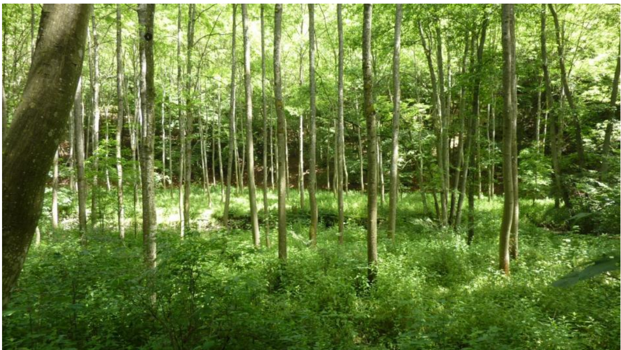
Eschen-Auenwald am Dörsbach unterhalb des Beilsteins südöstlich Attenhausen