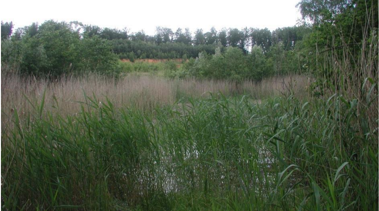
Schmidtenhöhe bei Koblenz, Tümpel im Naturschutzgebiet