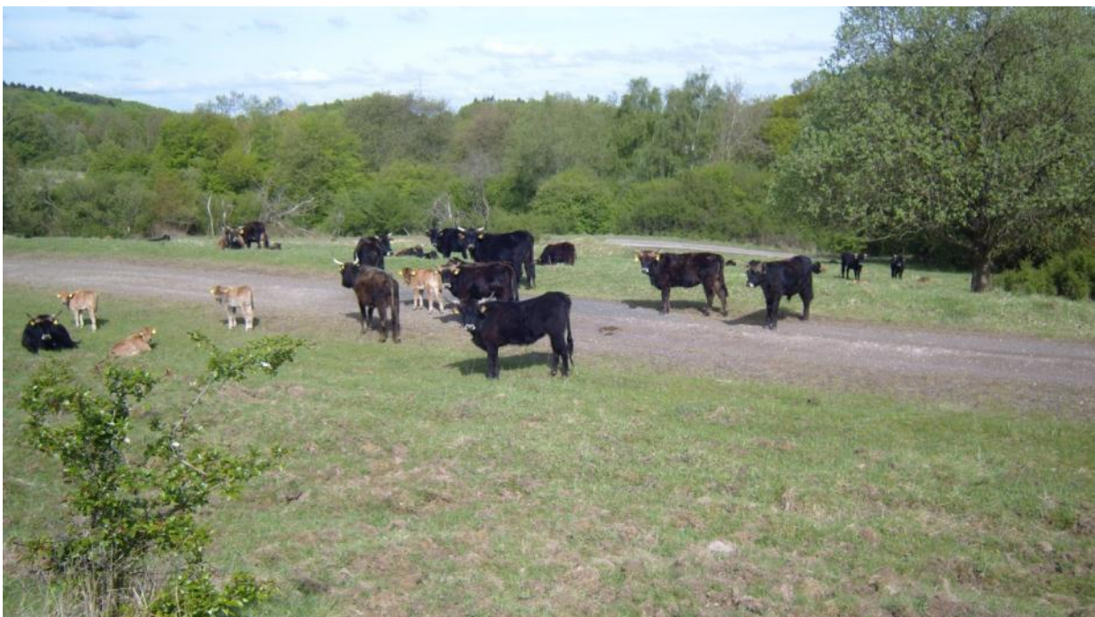
Halboffene Weidelandschaft Schmidtenhöhe, Beweidung mit Taurusrindern