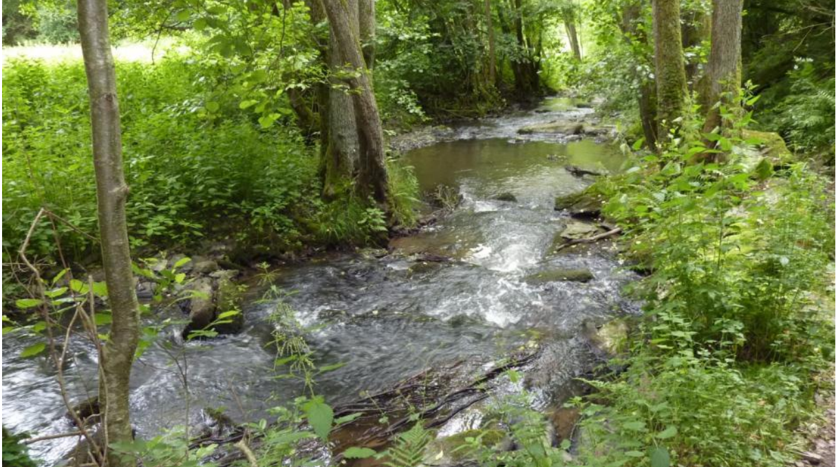
Dörsbach westlich Herold