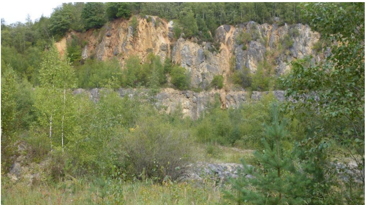
Felswand im Steinbruch Fachingen