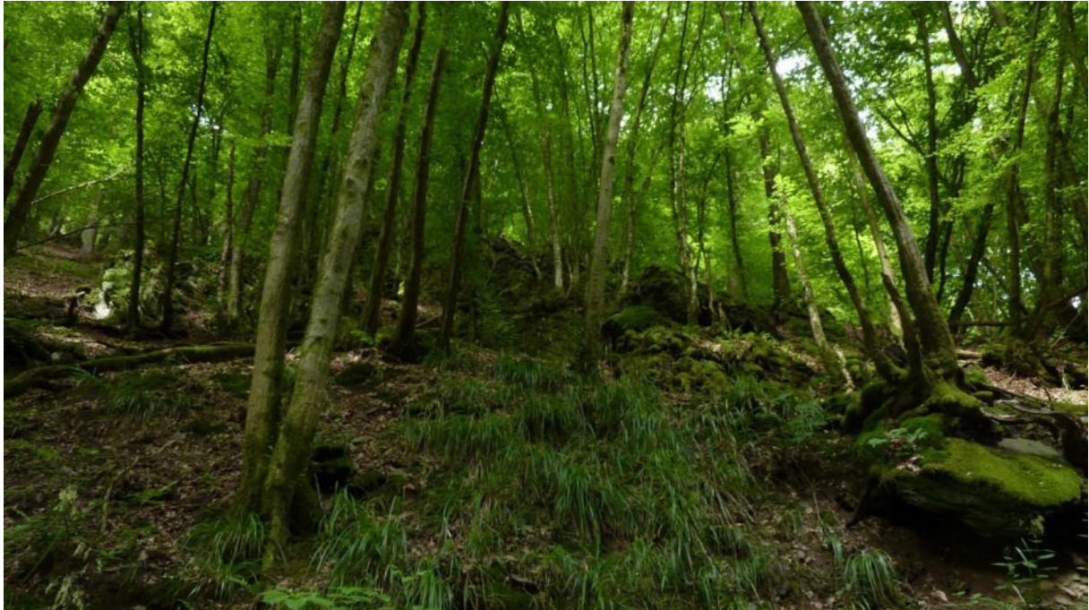
Hangwälder mit Schluchtwaldaspekt im Jammertal westlich Kördorf