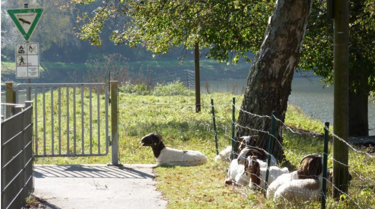
Beweidung des NSG Schleuse Hollerich