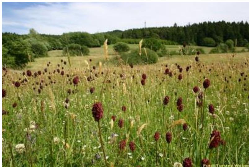
Magerwiese mit Wiesenknopf