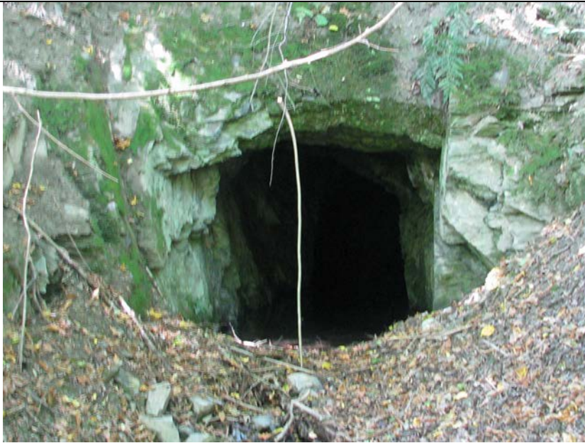
BWP_2013_04_N_14: Ehemaliger Schieferstollen, potentieller Lebensraum für Fledermäuse