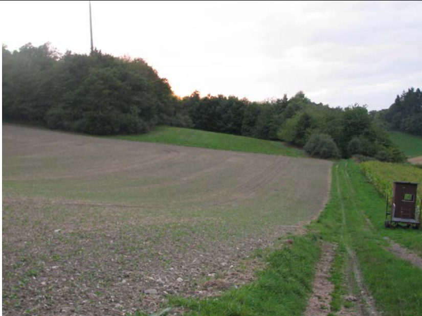
BWP_2013_04_N_09: In Ackerfläche umgewandeltes Dauergrünland