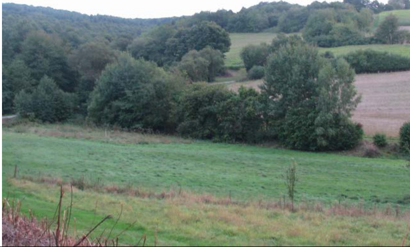
BWP_2013_04_N_06: Kleinteiliges Mosaik an Grünland und Gehölzstrukturen