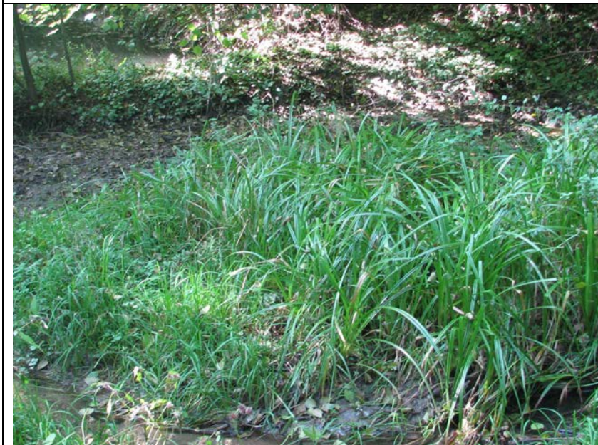
BWP_2013_04_N_13: Seggenbestand auf einer Insel im Bach