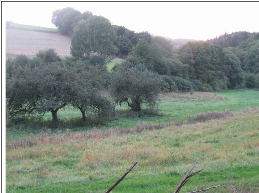
BWP_2013_04_N_04: Streuobstwiese und brachliegende Wiesen