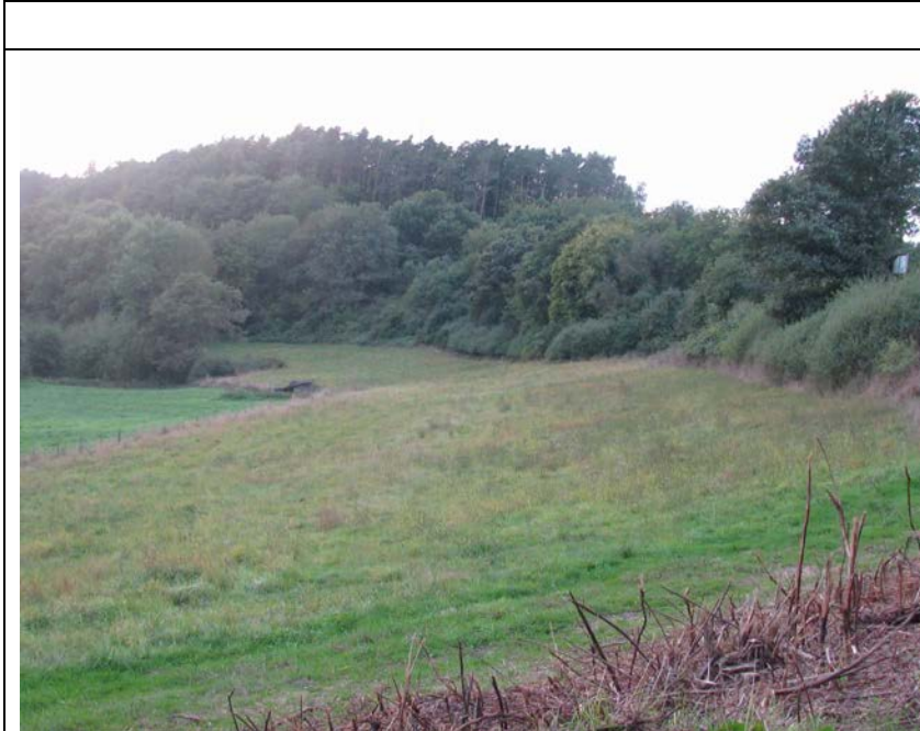
BWP_2013_04_N_05: Wiese und gut ausgeprägter Waldmantel