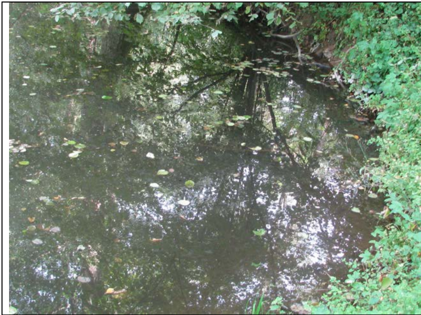
BWP_2013_04_N_12: Kleines stehendes Gewässer in der Bachaue des Altlayer Bachs