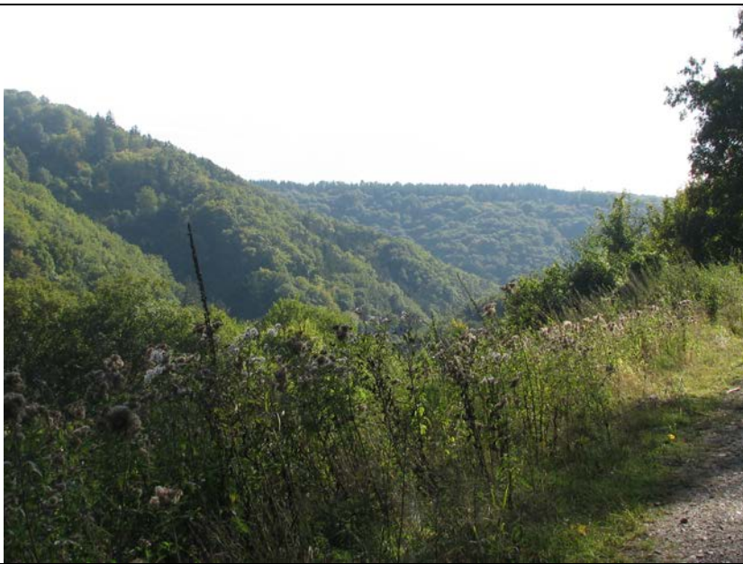
BWP_2013_04_N_35: Gebietsimpression im zentralen Teil des Altlayer Baachtals