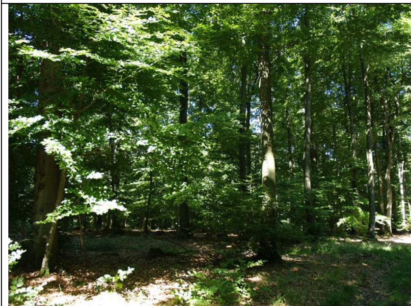
BWP_2013_05_N_08: Buchenwald außerhalb der Bachaue