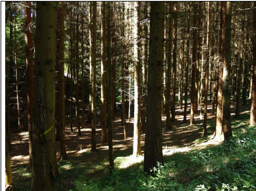
BWP_2013_05_N_05: Koniferenbestand auf Auwaldstandort