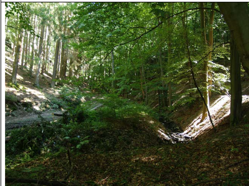
BWP_2013_05_N_06: Temporäres Nebengewässer des Kautenbachs