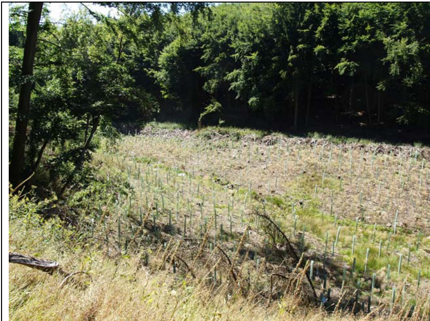
BWP_2013_05_N_07: Aufforstung nahe der Bachaue des Kautenbachs