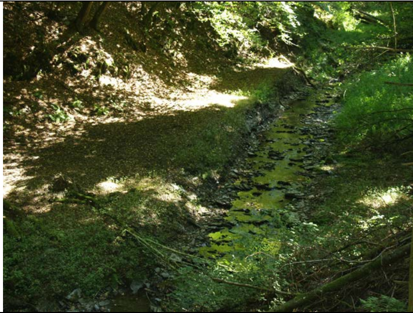
BWP_2013_05_N_03: Kautenbach bei niedrigem Wasserstand