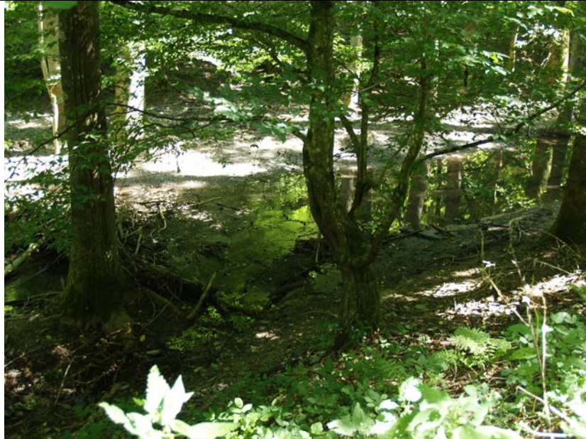
BWP_2013_05_N_04: Böschung zur Bachaue mit Auwald