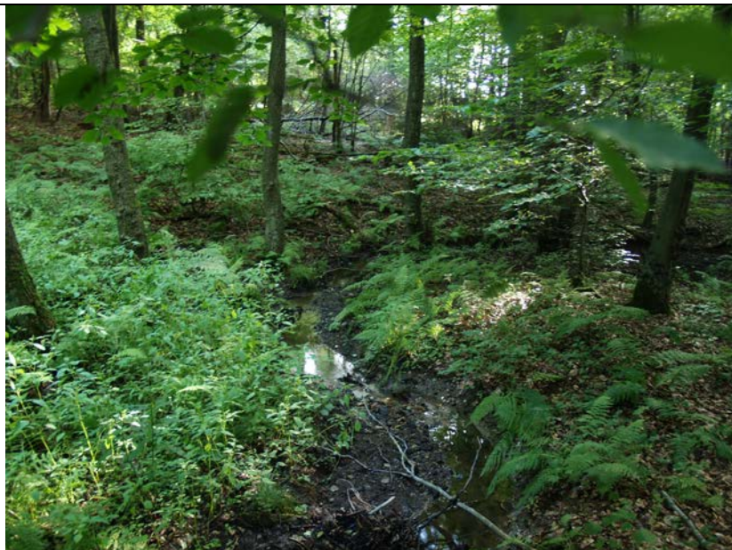
BWP_2013_10_N_24: Dörrebach mit niedriger Wasserführung