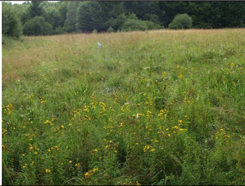
BWP_2013_10_N_05: Blütenpflanzenreiche feuchte Wiese