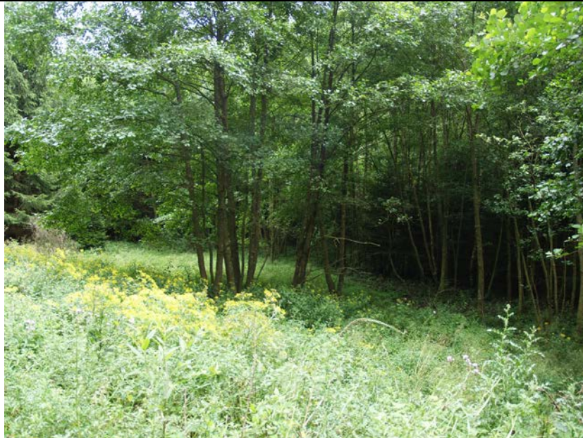
BWP_2013_10_N_20: Lichtung mit Hochstaudenflur