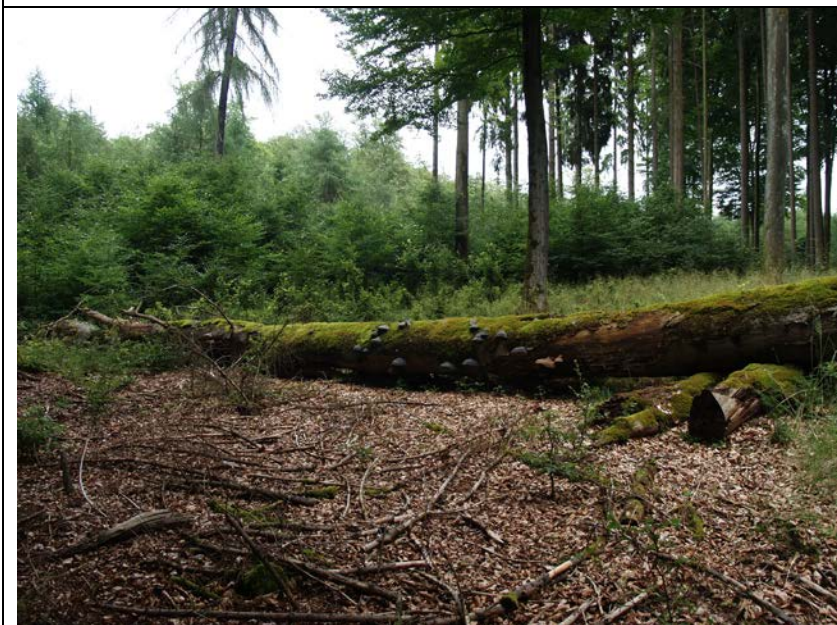
BWP_2013_10_N_17: Liegendes Totholz