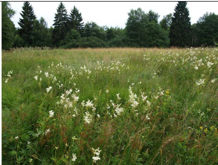
BWP_2013_10_N_08: Feuchtwiese mit Mädesüß