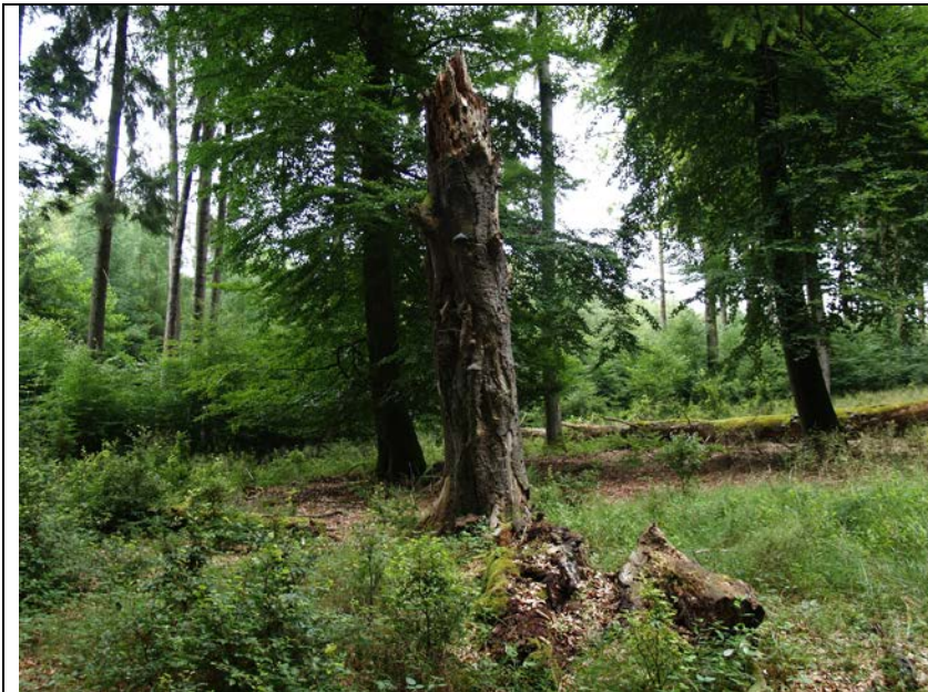
BWP_2013_10_N_16: Stehendes Totholz