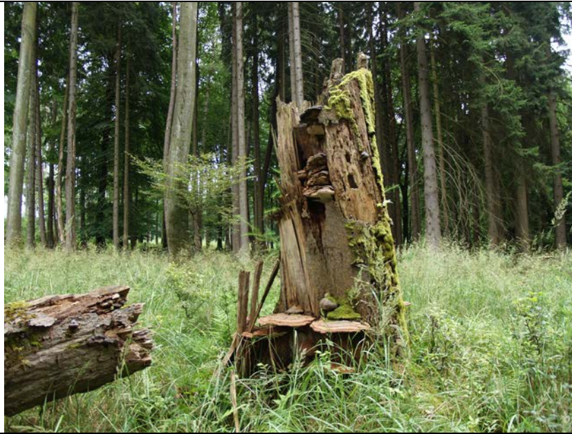
BWP_2013_10_N_18: Totholz mit Pilzen