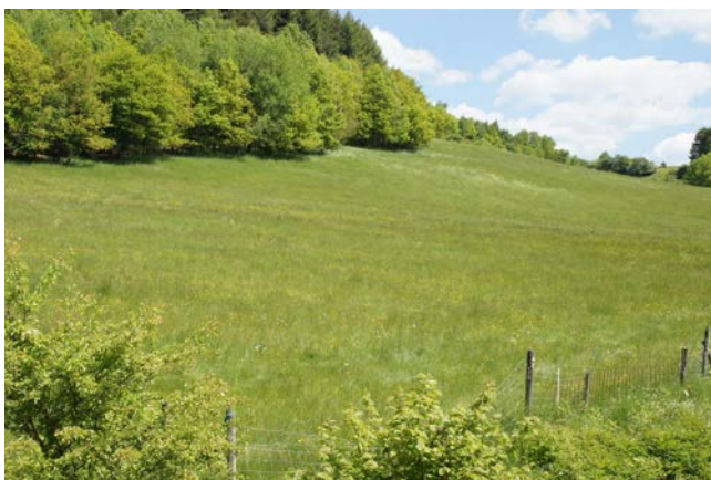
Abb. 18: Magerwiese südwestlich Haargartenhof. Diese knapp 3 Hektar große Mähweide (LRT 6510) mit vielen Kleinstandorten liegt ca. 12 m außerhalb des FFH-Gebiets. Koordinaten: 338697 / 5498501 Aufnahmedatum: 06.06.2013