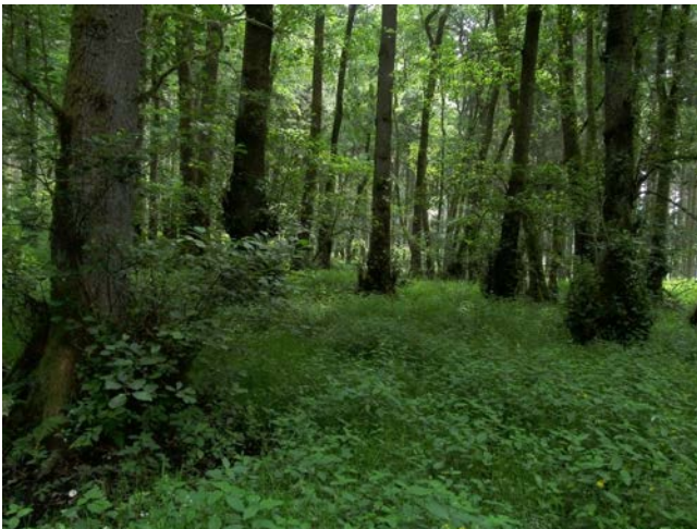
Abb. 31: Bachbegleitender Erlenwald nordwestlich "Gimpelbruch" (LRT 91E0). Koordinaten: 343689 / 5502991 Aufnahmedatum: 16.07.2013