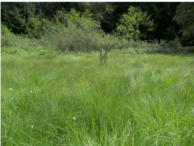
Abb. 24: Entwässerte Moorbereiche im nördlichen Weyrichsbruch (LRT 7140). Koordinaten: 341484 / 5503934 Aufnahmedatum: 23.07.2013