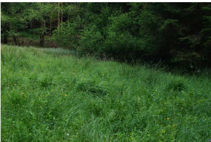
Abb. 44: Binsenwiese (yCC3) nördlich "Gimpelbruch". Koordinaten: 344567 / 5502818 Aufnahmedatum: 15.07.2013