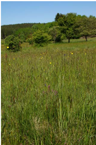
Abb. 17: Feuchter Borstgrasrasen (LRT 6230) mit Wald-Läusekraut im Panzborn bei Greimerath. Koordinaten: 330807 / 5492772 Aufnahmedatum: 04.06.2013