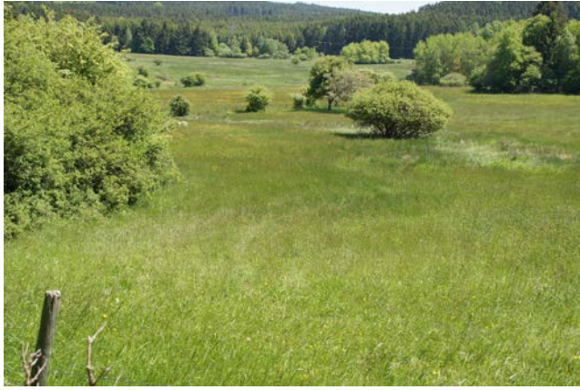
Abb. 4: Feuchtgebiet Panzborn bei Greimerath, nördlich des NSGs. Koordinaten: 330759 / 5492729 Aufnahmedatum: 04.06.2013