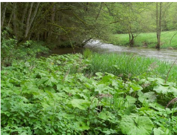
Abb. 21: Hochstaudensaum(LRT 6430) an der Ruwer nördlich Burg Heid, Blühaspekt der Pestwurz. Koordinaten: 336097 / 5501771 Aufnahmedatum: 14.05.2013