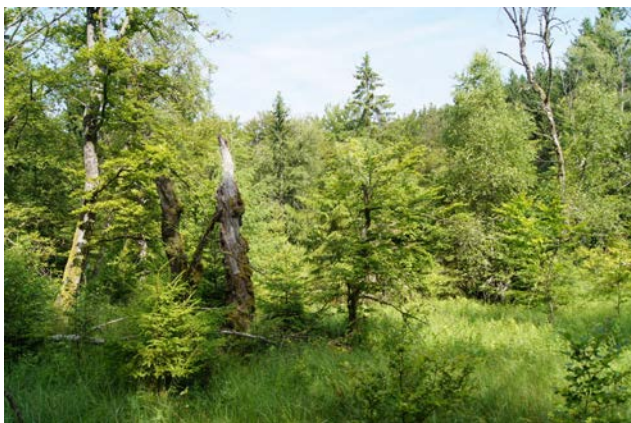
Abb. 28 Moorbirken-Moorwald am Altweiher (LRT 91D0) mit Naturverjüngung, stehendem und liegendem Totholz. In den Bestandslücken dominieren Binsen und Rasenschmiele. Koordinaten: 344160 / 5506223 Aufnahmedatum: 16.07.2013