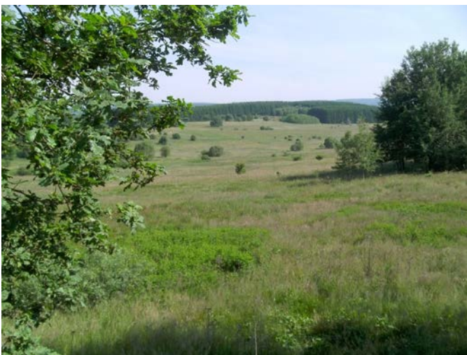
Abb. 3: Blick von Südwesten in die Keller Mulde. Koordinaten: 340647 / 5498843 Aufnahmedatum: 19.06.2013