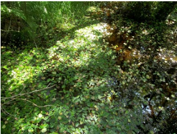
Abb.9: Waldtümpel mit Laichkraut südöstlich "Gattermannshäuschen", nördlich Heddert (LRT 3150). Koordinaten: 339445 / 5502455 Aufnahmedatum: 08.07.2013