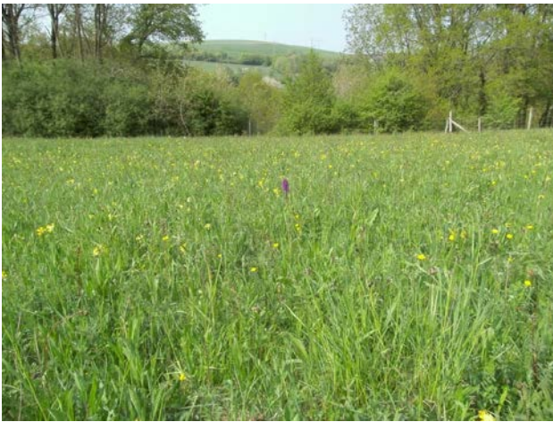
Abb. 20: Blütenreiche Magerwiese (LRT 6510) bei Gusterath, Blühaspekt von Echter Schlüsselblume und Stattlichem Knabenkraut. Koordinaten: 334945 / 5507477 Aufnahmedatum: 08.05.2013