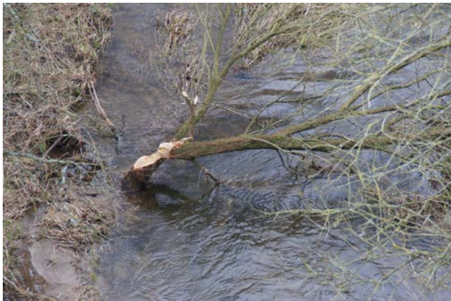
Abb.:51 Der Biber (FFH-Anhang II) ist im Winter 2013/2014 im FFH-Gebiet Ruwer und Seitentäler angekommen (hier: Ruwer bei Niederzell). Koordinaten: 340298 / 5498844 Aufnahmedatum: 06.02.2014