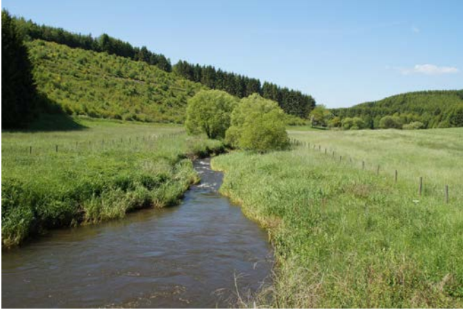
Abb. 1: Die Ruwer unterhalb der Keller Mulde wird beidseits von einem nicht genutzten Gewässerrandstreifen gesäumt (LRT 3260 und 6430). Koordinaten: 339042 / 5498387 Aufnahmedatum: 06.06.2013