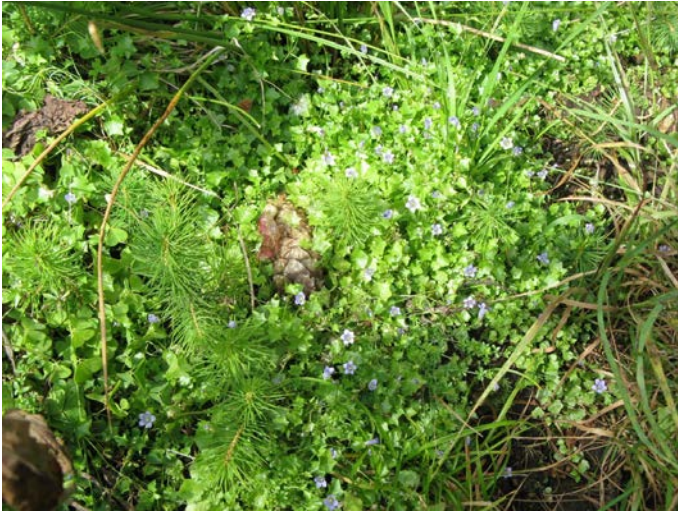
Abb.:48 Das Efeu-Moorglöckchen, Rote Liste 2, gehört zu den floristischen Besonderheiten im Ruwertal. Koordinaten: 338347 / 5496359 Aufnahmedatum: 20.07.2009