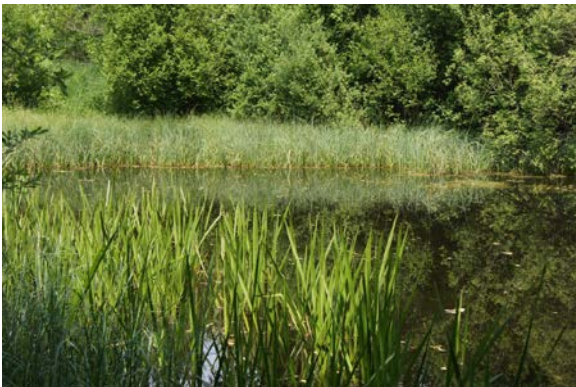
Abb. 10: Mesotropher Teich im Hinzerter Bachtal (LRT 3150), im Vordergrund: Igelkolben, am hinteren Gewässerrand: Blasenseggenried. Koordinaten: 337034 / 5496066 Aufnahmedatum: 17.07.13