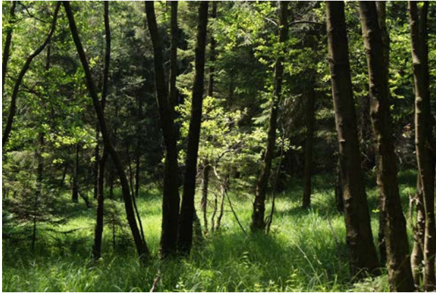
Abb. 32: Bachbegleitender Erlenwald (LRT 91E0) am Lannenbach. Koordinaten: 336076 / 5492349 Aufnahmedatum: 22.07.2013