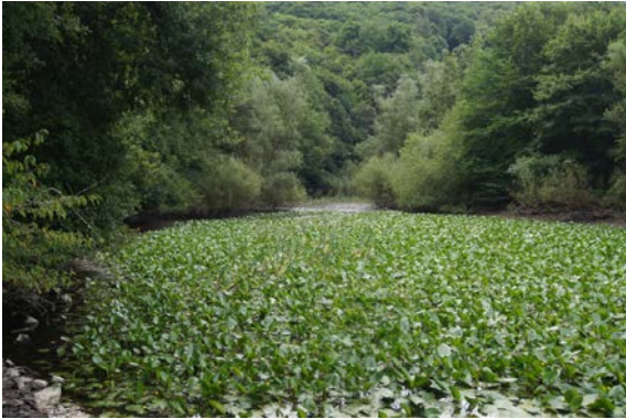
Abb. 8: Stauteich bei Sommerau (LRT 3150) mit Teichrosen im Hintergrund: Verlandungsbereich. Koordinaten: 337035 / 5509625 Aufnahmedatum: 12.08.2013