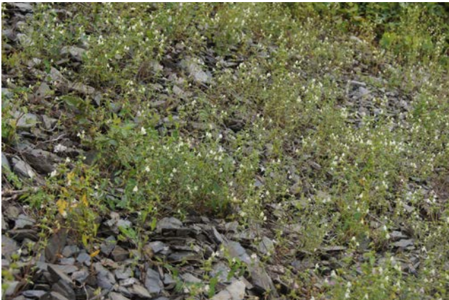
Abb. 30: Schieferschutthalde bei Sommerau mit Gelbem Hohlzahn (direkt angrenzend an das FFH-Gebiet). Innerhalb des Gebiets wurde kein Standort dieses Lebensraumtyps kartiert. Koordinaten: 322573 / 5519768/ Aufnahmedatum: 31.07.2012