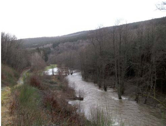
Abb. 5: Der Wasserstand der Ruwer steigt nach längeren Niederschlägen rasch an, hier Winterhochwasser im mittleren Ruwertal. Der gewässerbegleitende Hoch- staudensaum (LRT 6430, auf dem Bild komplett überflutet) und die Talwiese (LRT 6510, auf dem Bild teilweise über- flutet), liegen außerhalb des FFH-Ge- biets, das hier auf die Gewässerparzelle beschränkt ist. Koordinaten: 334578 / 5499899 Aufnahmedatum: 05.01.2012