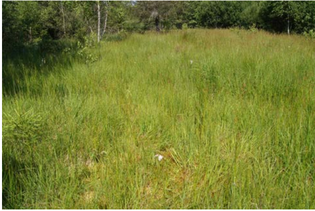
Abb. 25: Moorstandort im Hinzertter Bruch (LRT 7140), im Vordergrund blüht Scheidiges Wollgras Koordinaten: 337385 / 5496433 Aufnahmedatum: 17.07.2013