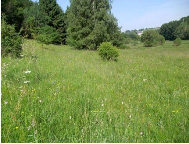
Abb. 19: Artenreiche Wiese (LRT 6510) auf der linken Ruwerseite östlich Niederkell in der westlichen Keller Mulde. Koordinaten: 340633 / 5498833 Aufnahmedatum: 19.06.2013