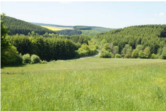
Abb. 2: Blick von der Magerwiese südwestlich Haargartenhof (LRT 6510) nach Südwesten. Der Ruwerradweg überspannt in der Bildmitte den von Erlen gesäumten Flonterbach. Koordinaten: 338800 / 5498673 Aufnahmedatum: 06.06.2013