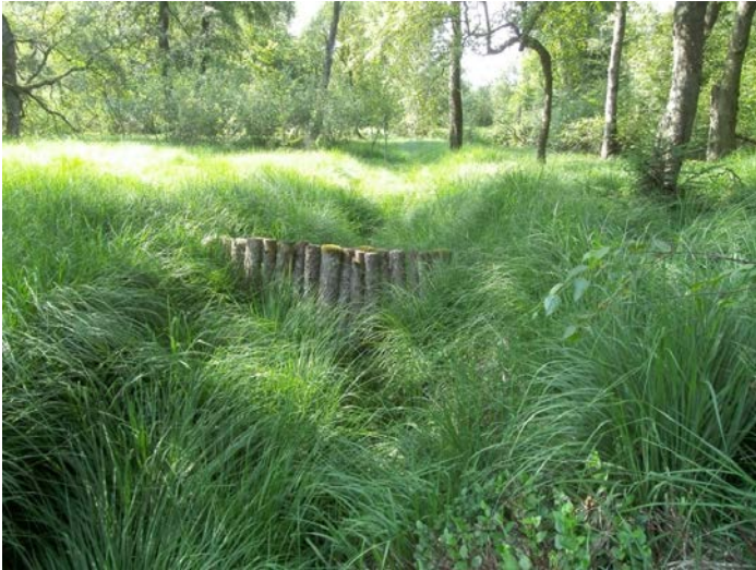
Abb. 45: Alte Staumaßnahme im NSG Weyrichsbruch. Koordinaten: 341381 / 5503957 Aufnahmedatum: 23.07.2013