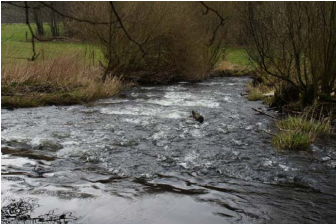
Abb. 46: Rückbau eines Mühlenwehres in der Ruwer südlich Hentern in eine Sohl- rampe zur Wiederherstellung der Durchgängigkeit für Wassertiere im Rahmen des Naturschutzgroßprojekts des Bundes „Ruwer und Neben- bäche“. Koordinaten: 333670 / 5497945 Aufnahmedatum: 17.03.2014