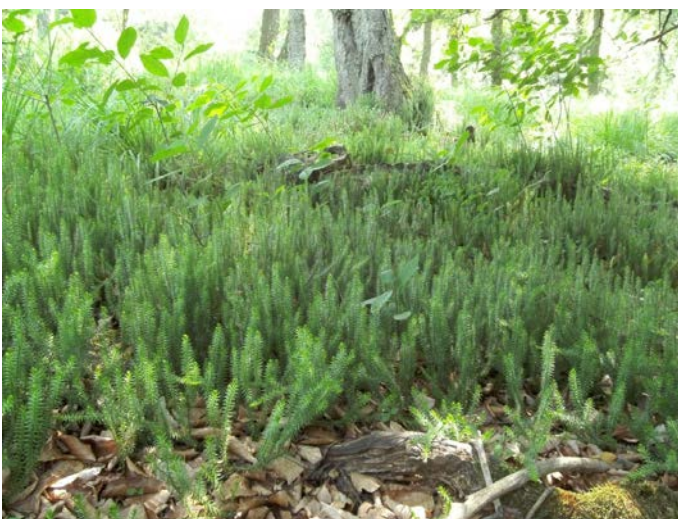
Abb.:50 Sprossender Bärlapp (FFH-Anhang V) im Weyrichsbruch. Koordinaten: 341403 / 5503946 Aufnahmedatum: 23.07.2013