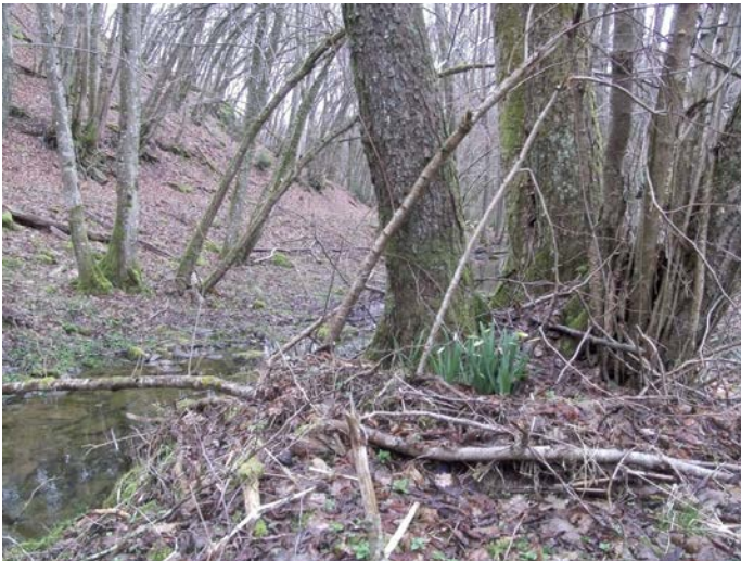
Abb.:49 Im kalten Frühjahr 2013 begann die Blüte der Wilden Narzissen im Ruwertal erst in der zweiten Aprilwoche. Koordinaten: 335223 / 5500503 Aufnahmedatum: 09.04.2013