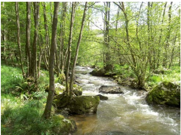
Abb. 35: Bachbegleitender Erlenwald (LRT 91E0) beidseits der Ruwer (oberer Mittellauf) nördlich Zuckerhutfelsen. Koordinaten: 337164 / 5497823 Aufnahmedatum: 06.06.2013