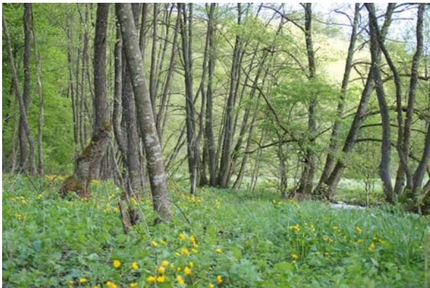
Abb. 38: Erlen-Auwald an der Ruwer (LRT 91E0) südlich Hinzenburger Mühle. Der Bestand ist - bis auf die mehrstämmigen Bäume an der Uferlinie - offensichtlich aus Pflanzung hervorgegangen. Koordinaten: 335161 / 5503393 Aufnahmedatum: 10.05.2013