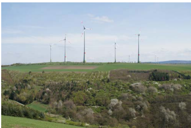
Abb. 7: Im Umfeld des FFH-Gebiets liegen mehrere Windenergieanlagen. Hier der Windpark "Auf Biedelt" oberhalb Waldrach, gesehen vom Hochbüschkopf, innerhalb des FFH-Gebiets. " Koordinaten: 338474 / 5513967 / Aufnahmedatum: 29.04.2013