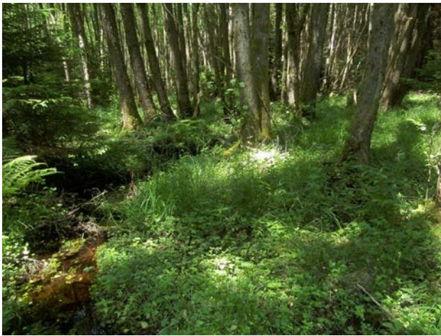
Abb. 37: Quellbach der Rauruwer und Erlenwald (LRT 91E0) nordöstlich Heddert. Koordinaten: 339379 / 5502505 Aufnahmedatum: 08.07.2013