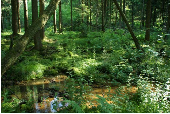
Abb. 42: Torfmoosreicher Erlen-Bruchwald (yAC4) im Ellersbachtal nördlich Feriendorf Kell. Koordinaten: 341523 / 5502568 Aufnahmedatum: 09.07.2013