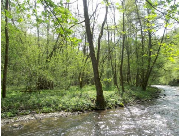
Abb. 36: Erlen-Auenwald (LRT 91E0) an der Ruwer östlich Ollmuth. Koordinaten: 335575 / 5504453 Aufnahmedatum: 08.05.2013