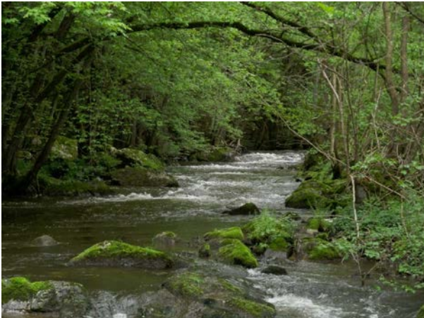
Abb. 13: Strukturreiches Bachbett der Ruwer nördlich Burg Heid (LRT 3260). Koordinaten; 335911 / 5502749 Aufnahmedatum: 14.05.2013