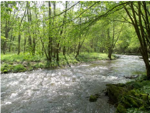
Abb. 14: Ruwer (LRT 3260) und bachbegleitender Erlenwald (LRT 91E0) östlich Ollmuth. Das FFH-Gebiet umfasst auch hier nur die Gewässerparzelle. Koordinaten; 335576 / 5504433 Aufnahmedatum: 08.05.2013