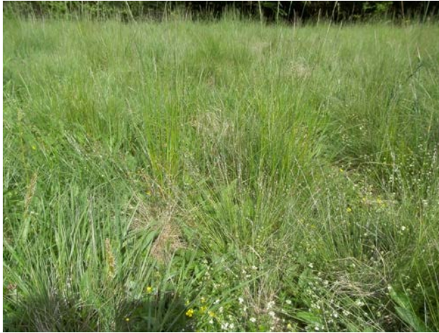
Abb. 16: Borstgrasrasen (LRT 6230) auf der Ruwerwiese "im untersten Marderbruch". Koordinaten: 336180 / 5498028/ Aufnahmedatum: 12.06.2013