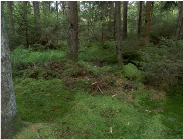
Abb. 43: Fichtenforst auf Moorstandort im Eselsbachtal südlich Hirschfelderhof. Durch bodenschonendes Herausnehmen der Fichten kann eine Aufwertung des Lebensraums erreicht werden. Koordinaten: 335009 / 5494257 Aufnahmedatum: 09.08.2013