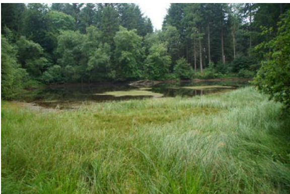
Abb. 11: Pionierweiher im Eschbachtal (LRT 3160), Uferbereich mit Torfmoosen, Seggen und Binsen. Koordinaten: 344413 / 5507340 Aufnahmedatum: 25.07.2013