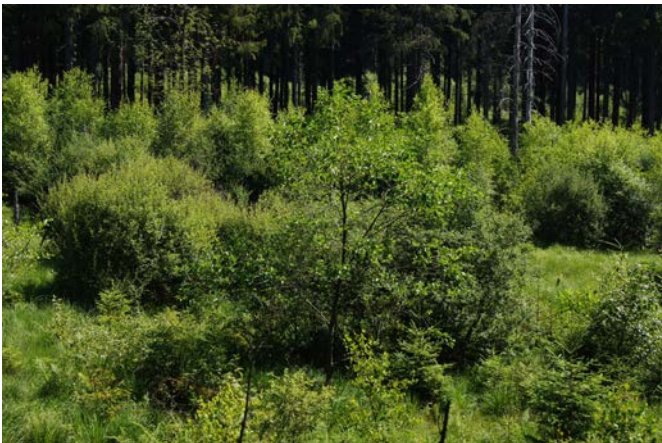
Abb. 41: Bruchgebüsche im Holzbachtal. Koordinaten: 339257 / 5494009 Aufnahmedatum: 22.07.2013