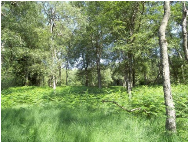
Abb. 27: Vordringen von Adlerfarn in trockenem Moorbirkenwald im "Weyrichsbruch" südwestlich "Rösterkopf". Koordinaten: 341407 / 5504020 Aufnahmedatum: 23.07.2013