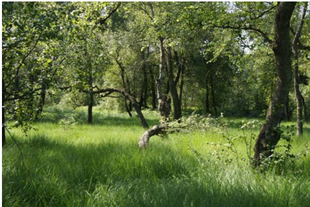
Abb. 26: Lichter Moorbirken-Moorwald im "Weyrichsbruch" bei Kell am See Koordinaten: 341473 / 4403899 Aufnahmedatum: 23.07.2013