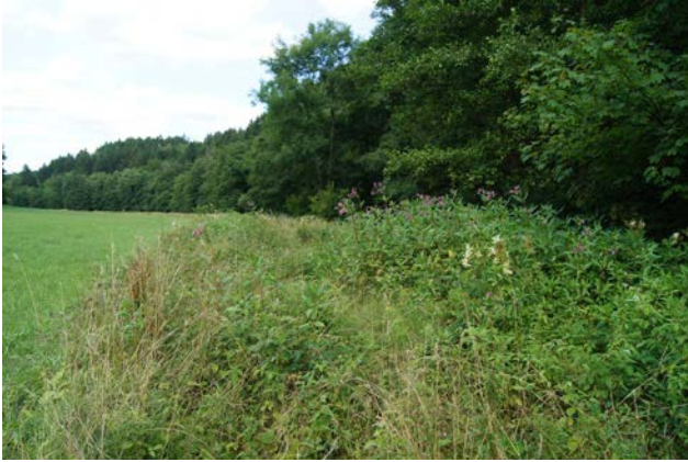
Abb. 22: Hochstaudensaum (LRT 6430) entlang der Ruwer östlich Kimmlerhof. Auch hier ist das FFH-Gebiet auf den Ruwerlauf begrenzt, der Gewässerrandstreifen liegt bereits außerhalb des FFH-Gebiets. Koordinaten: 335076 / 5500081 Aufnahmedatum: 04.08.2013