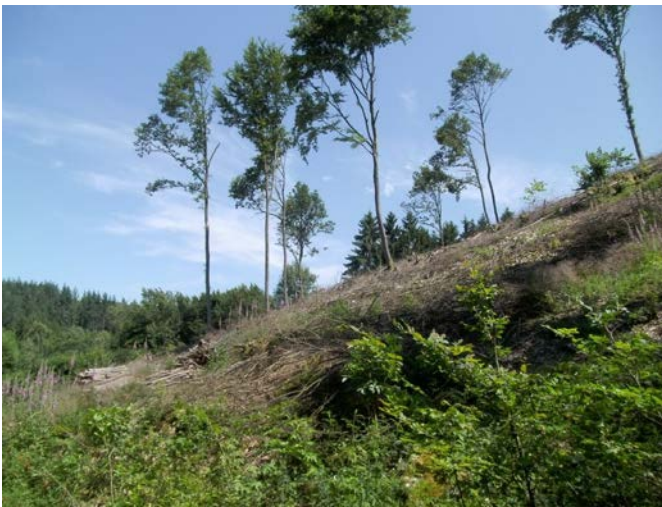
Abb. 40: Aktuelle Niederwaldnutzung im Tal der Rauruwer südlich Hedderter Mühle. Koordinaten: 337169 / 5502043 Aufnahmedatum: 08.07.2013