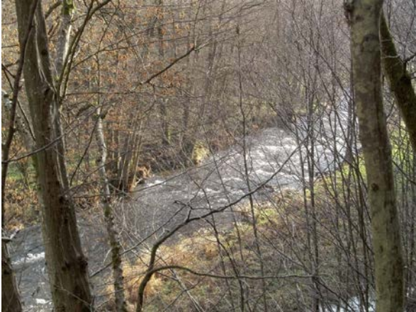
Abb. 12: Mittleres Ruwertal zwischen Hentern und Burg Heid im Winter (LRT 3260). Koordinaten; 335132 / 5500395 Aufnahmedatum: 11.12.2011