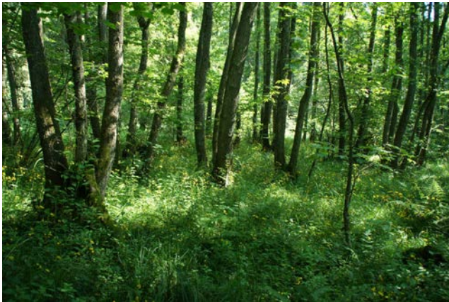
Abb. 33: Erlen-Bachauenwald "Im Fahrmisch" nördlich Feriendorf Kell (LRT 91E0). Koordinaten: 341555 / 5502423 Aufnahmedatum: 09.07.2013