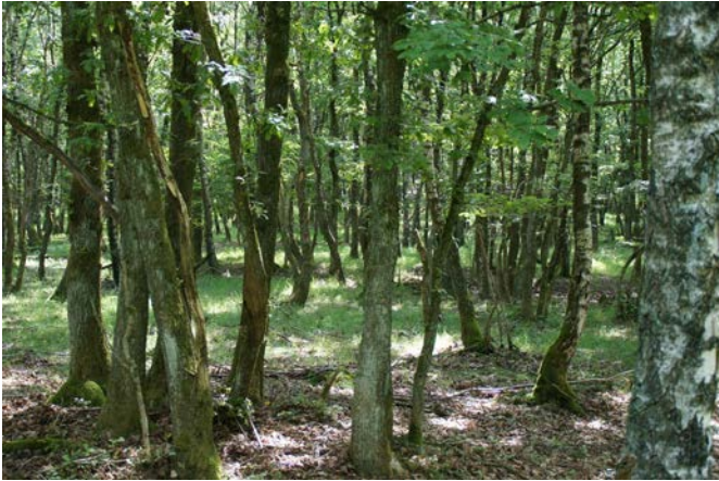
Abb. 39: Eichen-Birken-Niederwald am Ende der Umtriebszeit nördlich "Raukopf" bei Zerf. Koordinaten: 335527 / 5496869 Aufnahmedatum: 09.07.2013