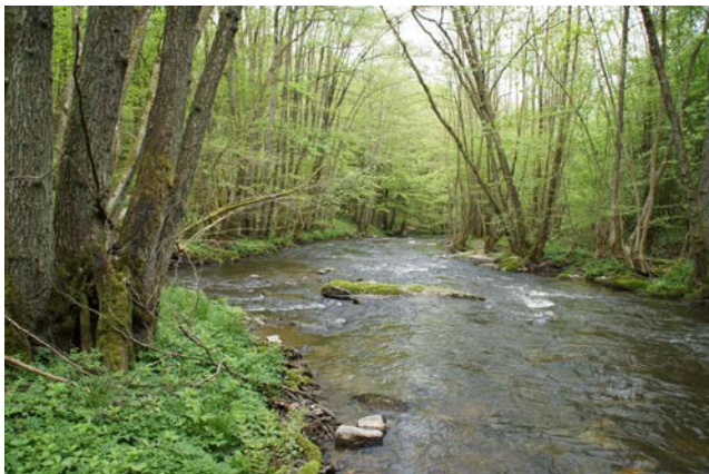
Abb. 6: Erlen-Auwald östlich Geisemerich. Über lange Strecken des Mittel- und Unterlaufs der Ruwer wurde, wie hier, nur die Flussparzelle als FFH-Gebiet ausgewiesen, der bachbegleitende Erlenwald (LRT 91E0) liegt bereits außerhalb des FFH-Gebiets.. Koordinaten: 335472 / 5502748 Aufnahmedatum: 21.05.2013