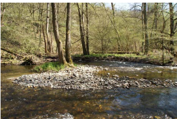
Abb. 15: Ruwer, unterer Mittellauf, zwischen Waldrach und Sommerau (LRT 3260). Koordinaten; 336829 / 5510183 Aufnahmedatum: 25.04.2013