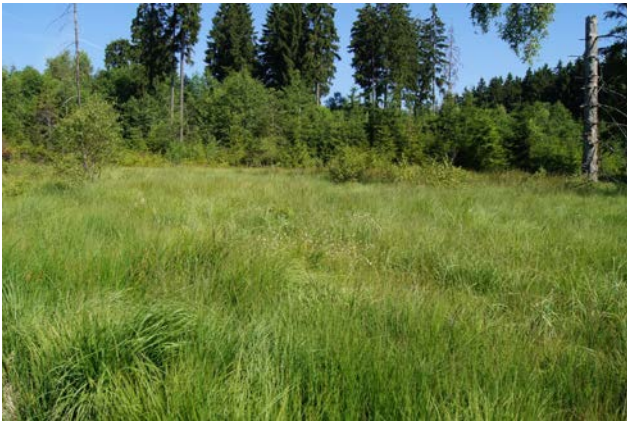
Abb. 23: Moor im Holzbachtal (LRT 7140), in der Bildmitte: Scheidiges Wollgras. Koordinaten: 339122 / 5494157 Aufnahmedatum: 22.07.2013