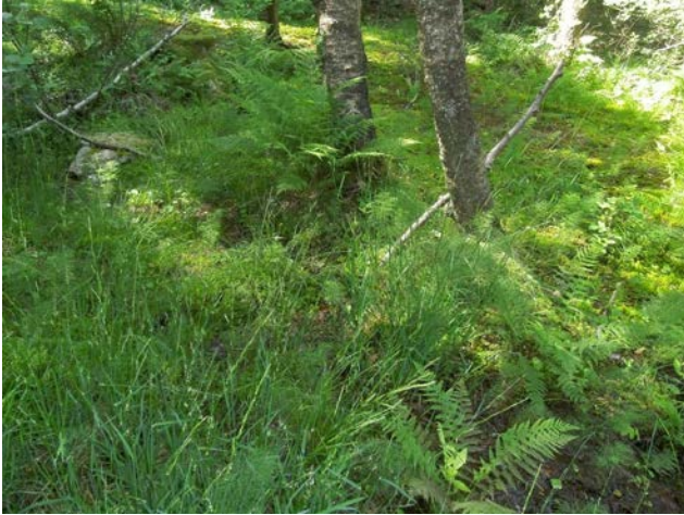
Abb. 29 Quelliger Birkenmoorwald nördlich Heddert (LRT 91D0). Das Biotop liegt an der Grenze des FFH-Gebites und teilweise außerhalb. Koordinaten: 338106 / 5502325 Aufnahmedatum: 08.07.2013