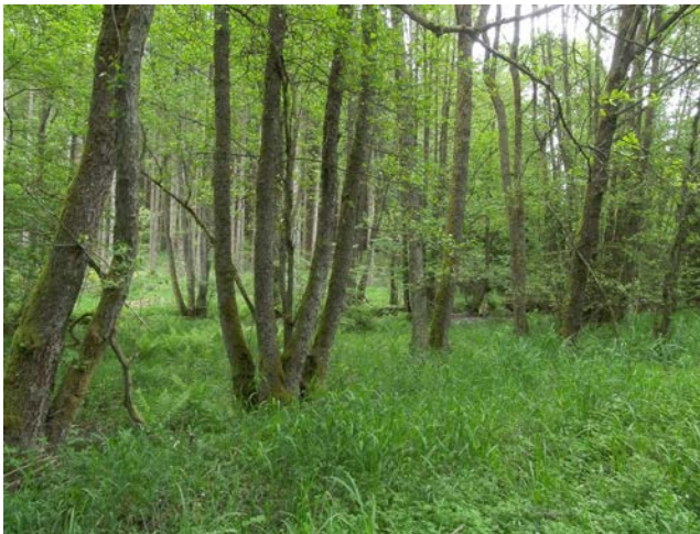
Abb. 34: Bachbegleitender Erlenwald an der Ruwer östlich Heckelbuschfelsen (LRT 91E0). Koordinaten: 336457 / 5497980 Aufnahmedatum: 12.06.2013